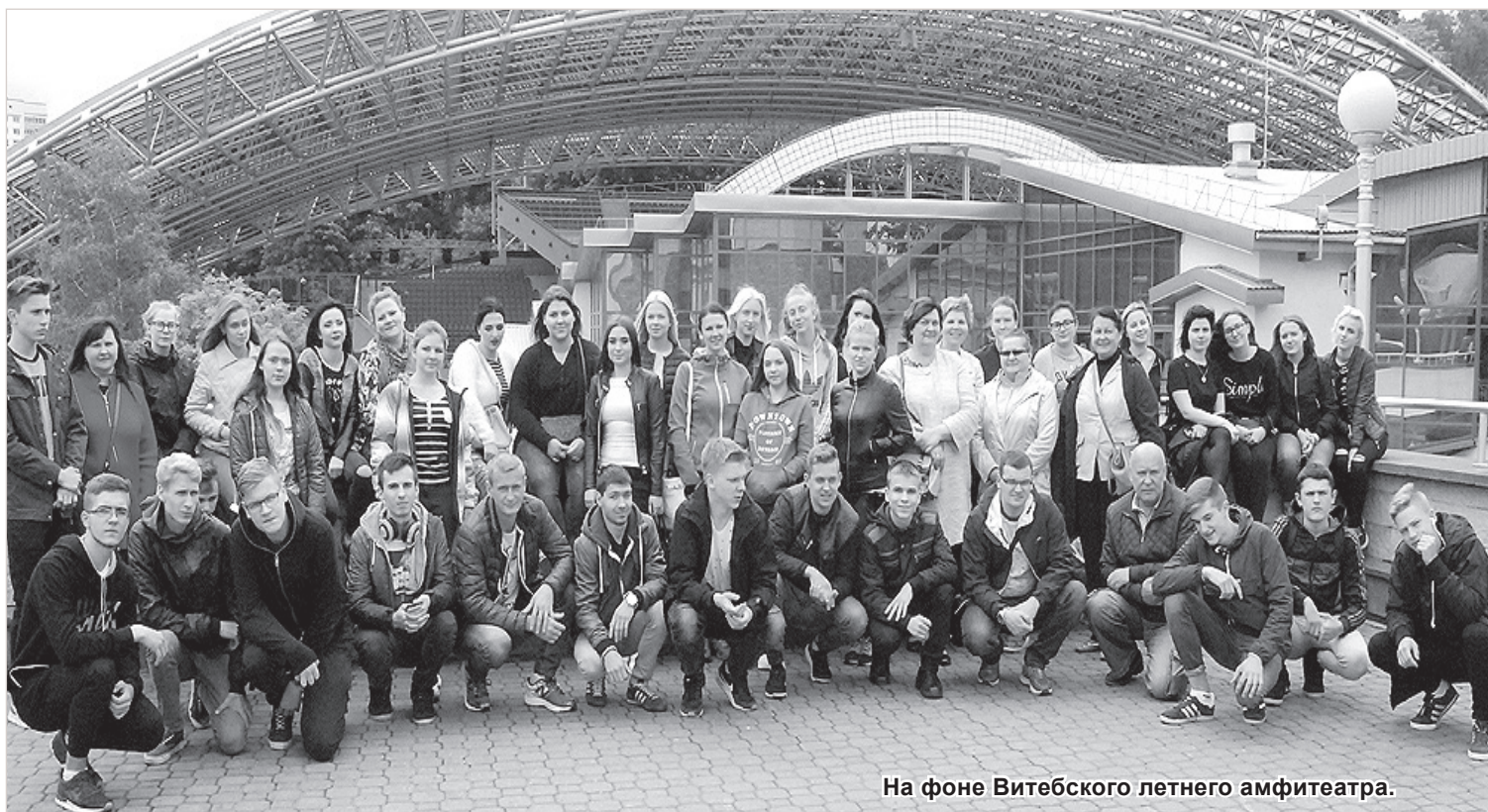
На фоне Витебского летнего амфитеатра.