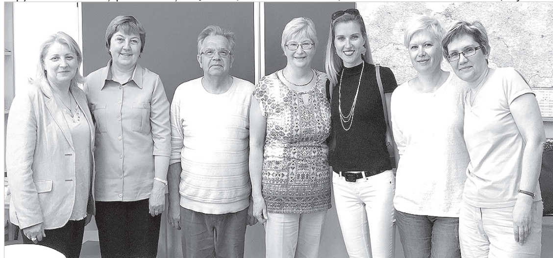
Обязательный визит в гимназию.

Мой прощальный вопрос госте редакция: «Так где лучше жить?». Немного поразмыслив, очаровательная красавица ответила так: «В финансовом отношении — там, где в благополучных странах Запада труд оплачивается более достойно, а уровень жизни несравнимо выше. Зато в плане безопасности проживания спокойная Латвия выигрывает. В США сложилась такая ситуация, когда родители вынуждены постоянно сопровождать школьников. Уличная преступность — печальная реальность, случаются и похищения детей. И только там по-настоящему пони-