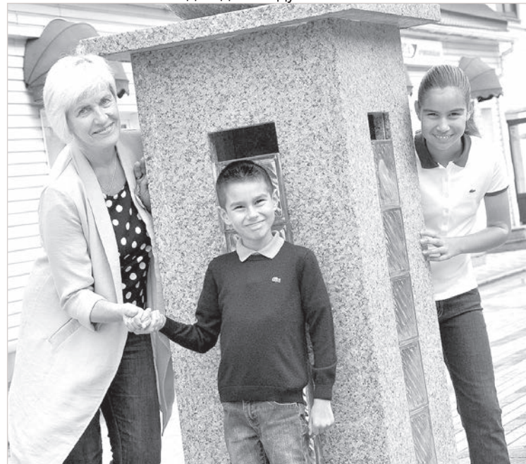
Латвийская бабушка и американские внуки.