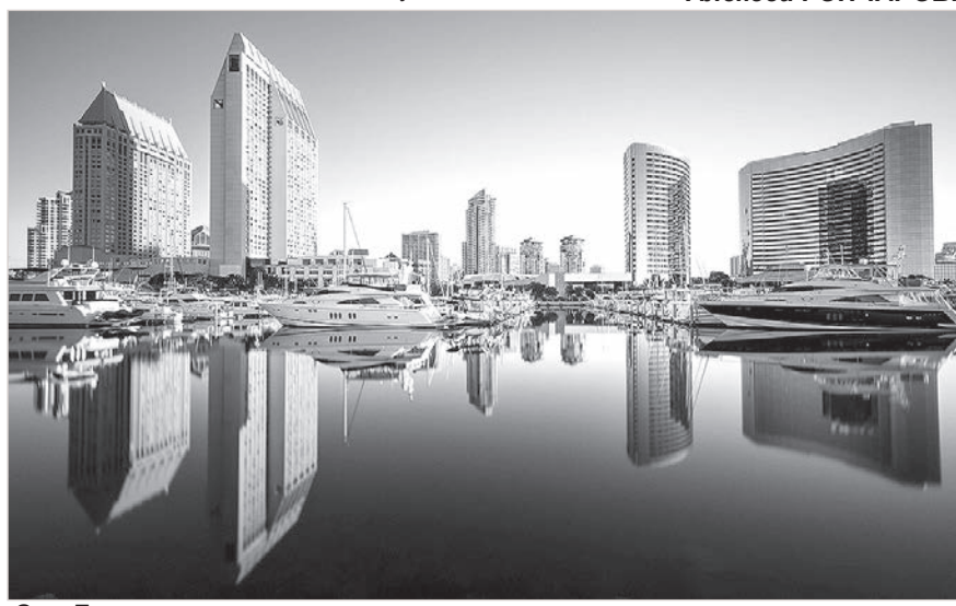
Сан-Диего — вторая родина.