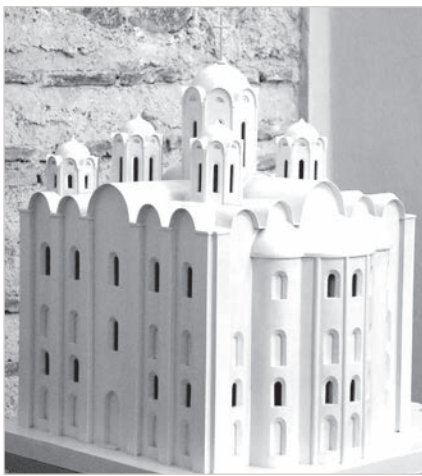
Модель Софийского собора.

Знакомство с фауной Беларуси много времени не