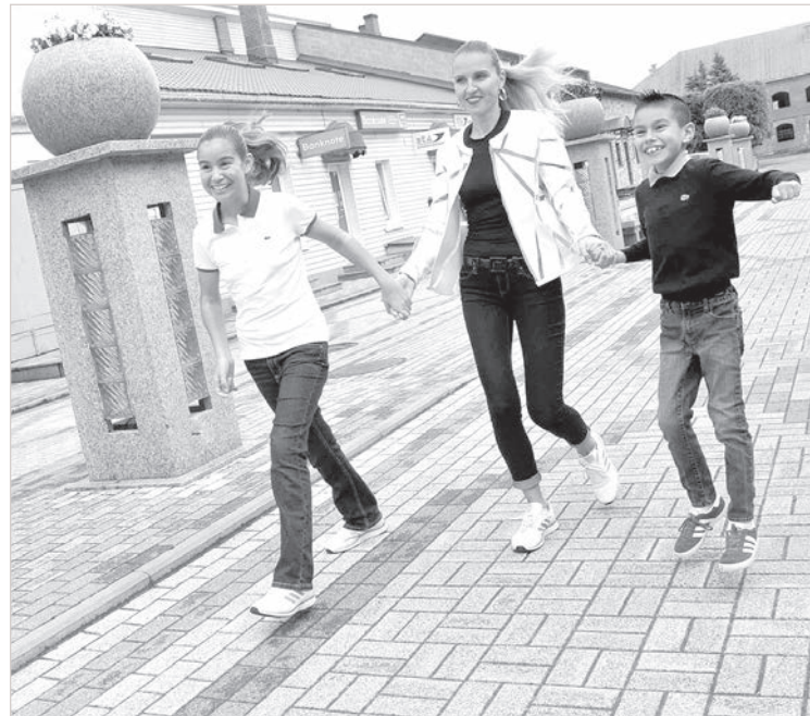
На отдыхе в Краславе.