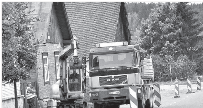
Краслава. Ремонтные работы на улицах Райня и Лачплеша.