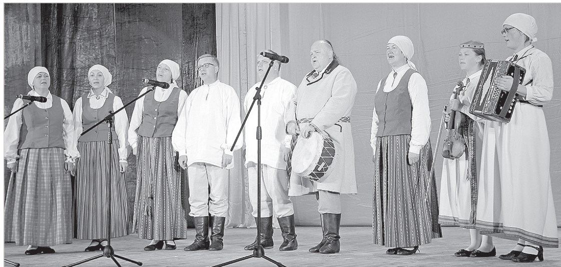
Выступление фольклорной группы «Sovvaļņiki» на открытии юбилейного мероприятия в Смоленском художественном институте.

Сибирь, крестьянам Курземской и Видземской губерний предлагали купить землю поблизости от границы с Латвией. За короткое время крестьяне укрепили свои хозяйства, особенно этому способствовали реформы Столыпина, поддерживавшие усадьбы, сельскохозяйственное производство росло. Хотя латыши получили самые неплодородные земли с лесами и болотами, однако со временем были запаханы поля, появились хозпостройки, были посажены плодовые деревья и цветы. Это вызывало зависть и недоброжелательство местных. Поэтому латышские общества жили достаточно обособленно. В 1897 году, по данным переписи населения, в Смоленской губернии числилось 3500 латышей. Во время Первой мировой войны из Риги эвакуировали железнодорожные мастерские, и поэтому большая масса латышей появилась также в городах. Смоленское латышское общество было сформировано в 1916 году, когда во время Первой мировой войны беженцы активно создавали организации взаимопомощи. Начали формироваться школы, кассы взаимопомощи, газеты. Был создан латышский театр. В Смоленском латышском клубе существовали различные кружки, хор, оркестр, издательство. Новая волна активизации латышей заметна после 1920 года, когда Латвийская Республика заключила мирный договор с Советской Россией. По идеологическим соображениям многие латышские политэмигранты отправились в «счастливые» советскую страну, вновь пополнив ряды латышских организаций. Однако с изменением