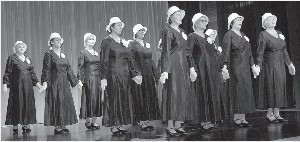
Юбиляры на сцене.

25 сентября в 14 часов в зале Краславского ДК состоялся юбилейный концерт танцевального ансамбля сениоров «Mežrozīte».