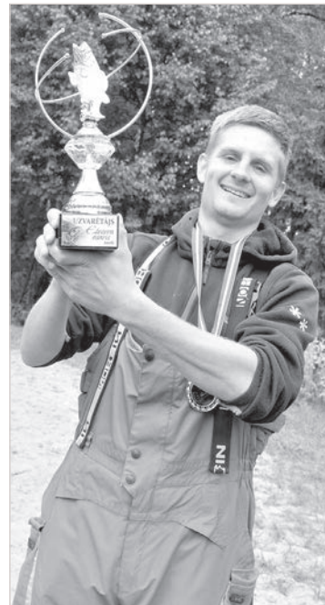
Восемь часов соперничества, кипения спортивных страстей, радости и разочарования. А еще — горячая уха на озерном берегу. О том, как проходили соревнования спиннингистов в Дагдском крае – в следующем номере.