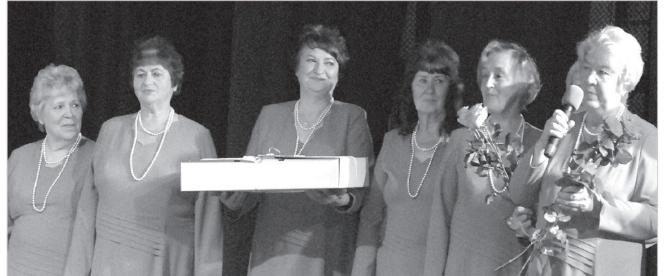
Поздравление от вокального ансамбля «Varavīksne».

ли танцевальные коллективы сениоров из Екабпилса, Даугавпилса, Ливан, Варкавы, Андрупене, Индры. Каждое