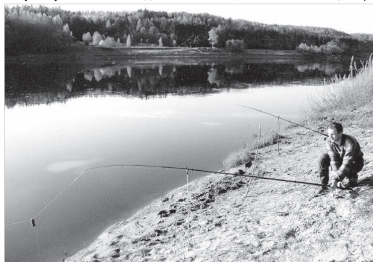
Уютный бережок для донной ловли.

Теплый дождичек не унимался, ласточки все чаще чер-