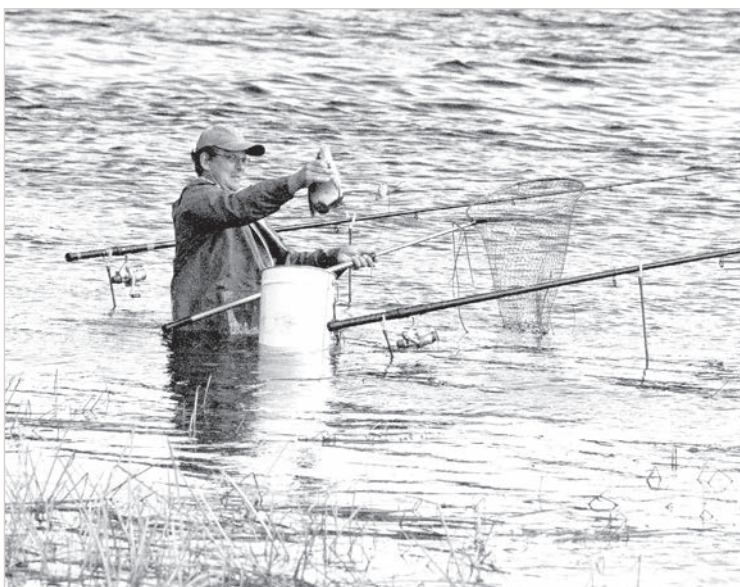
Ловля на фидер под Пиедруей.

Конечно же, и в этом году был вылет поденки, только из-за беспрестанных дождей никто его не заметил. За долгую рыболовную практику второго такого случая не припомню.