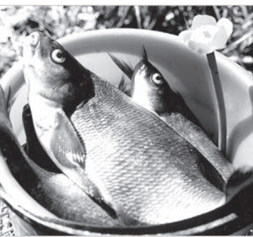
Речная рыбка — красивая и вкусная.

моторные лодки, поэтому была надежда дожждаться леща. Около девяти утра первый желтобкий красавец после недолгого вываживания благополучно успокоился в подсаче-