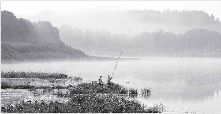
Рассвет над Даугавой.

Столь дождливого лета за всю жизнь не припомню. Конечно же, частенько выпадали годы, когда на Лиго лило как из ведра, и редким счастливым удавалось встретить Янову ночь у большого костра. Случалось видеть, и не раз, как заготовленные стога сена отражались в летних разливах на лугах. Но чтоб лило почти два месяца подряд... И по сей день не всем жителям села повезло заготовить сено, а настоящих фермеров выручают рулонные технологии заготовки кормов. Самое время продолжать жат-