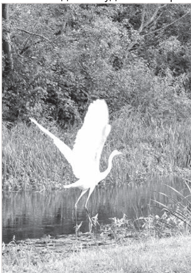
Белых цапель становится больше.

Столь дождливого лета за всю жизнь не припомню. Конечно же, частенько выпадали годы, когда на Лиго лило как из ведра, и редким счастливым удавалось встретить Янову ночь у большого костра. Случалось видеть, и не раз, как заготовленные стога сена отражались в летних разливах на лугах. Но чтоб лило почти два месяца подряд... И по сей день не всем жителям села повезло заготовить сено, а настоящих фермеров выручают рулонные технологии заготовки кормов. Самое время продолжать жат-