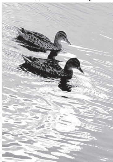
Пока непуганые кряквы.

Чрезвычайно трудным выдался сезон открытой воды для поклонников фидерной снасти. Тем не менее, достоверные слухи о поимке трех-четырёхкилограммовых лещей долетали в редакцию из Пиедруйской и Калниешской волостей. Точно знаю: пойман двухкилограммовый язь, а трофейными головлями в наших краях никого не удивишь. Прав-