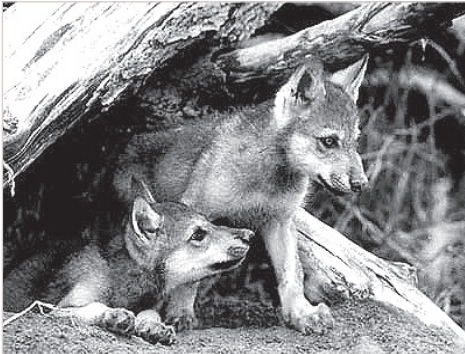
Пока безобидные волчата.

При первой возможности отправился в Вейзинишки, путь недалек — всего в верстах семи от Дагды. Отсюда берет начало большой лесной массив, который тянется до Свариней. Здесь, где кончается Дагдское озеро, развернули свое крестьянское хозяйство Шведы еще в трудном девятом первом году. Постепенно собственные владения перевалили за два десятка гектаров, и в этой обезлюдившей стороне,