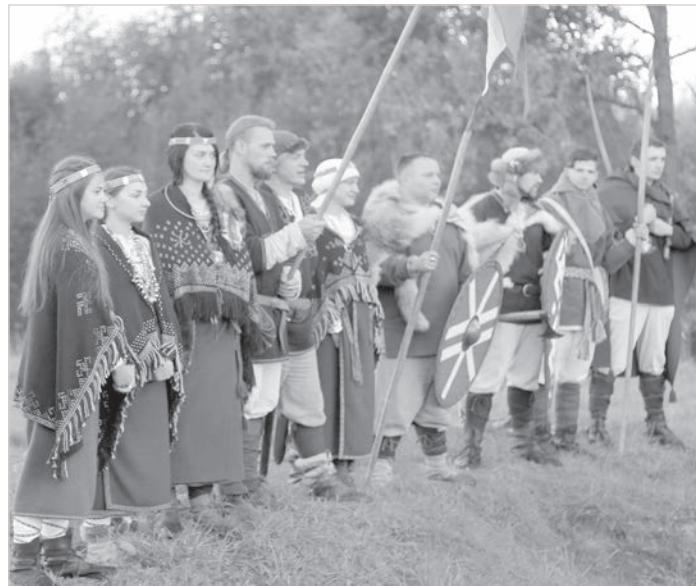
Гора Крома.

Помню, как я была уже здесь, в Андрупене, и во двор приехала большая грузовая машина с нашими вещами. Наш дом находится около озера Оловец.