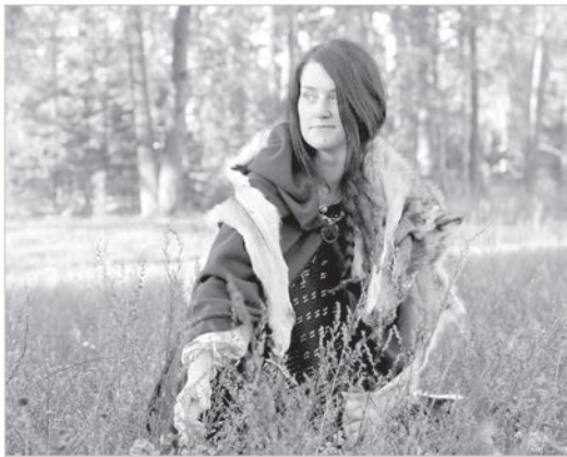
Гора Крома.