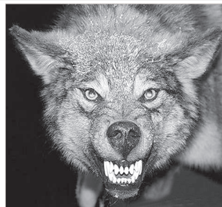
Матерый — гроза лесных обитателей.

придется, ведь не одни Шведы овец держат, а радиус охоты волчьих стай будет расширяться.