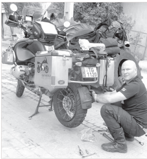
Черный континент: смена покрышек.