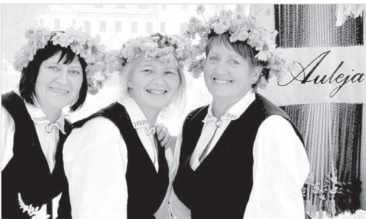
Праздничная ярмарка в Краславе.