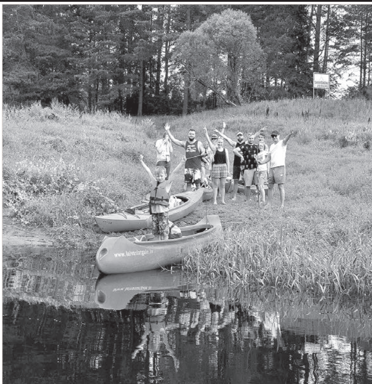
Туристический сезон продолжается — в любую погоду!