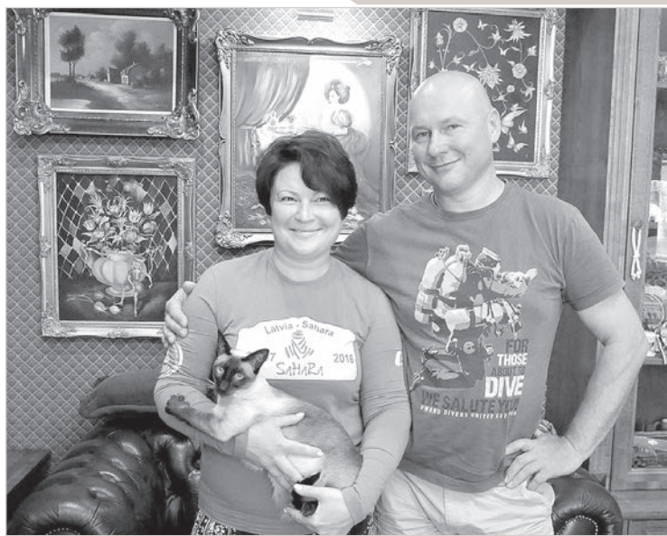
По возвращении из африканского пекла.