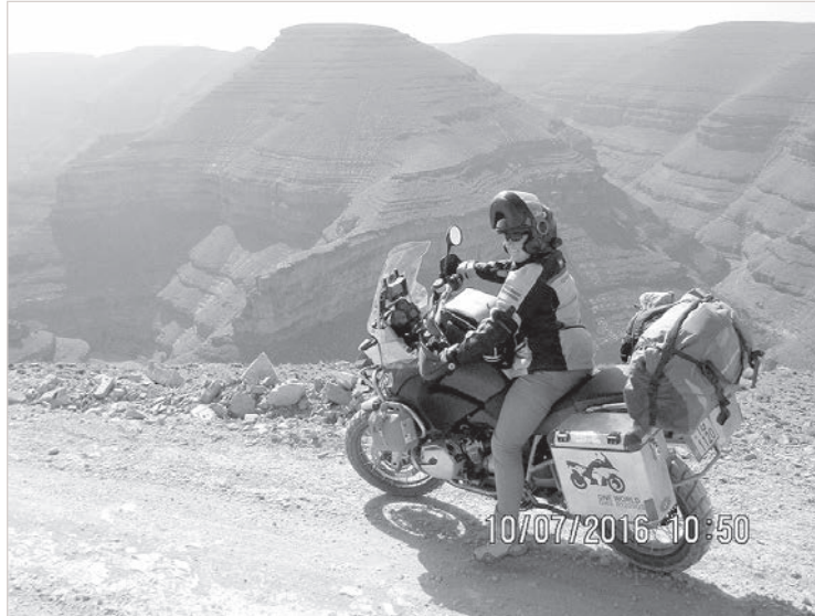
Покорение вершины 10 июля.

шую плату, по нашим меркам — символическую. А вот закланателей змей увидели лишь после рассвета, поняли: ночью кобры, гремучие змеи и прочие страшные твари могли бы расползтись. У каждого закланателя — три-четыре десятка змей, послушных своему повелителю. Зрелище не для слабонервных.