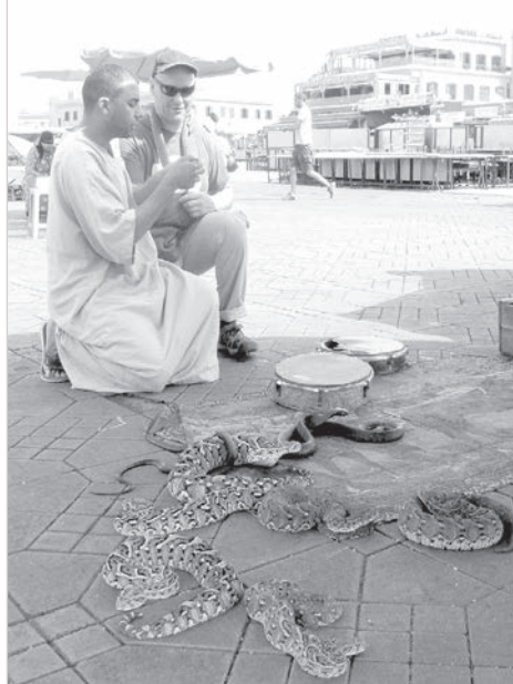
Заклинатель змей в Марракеше.