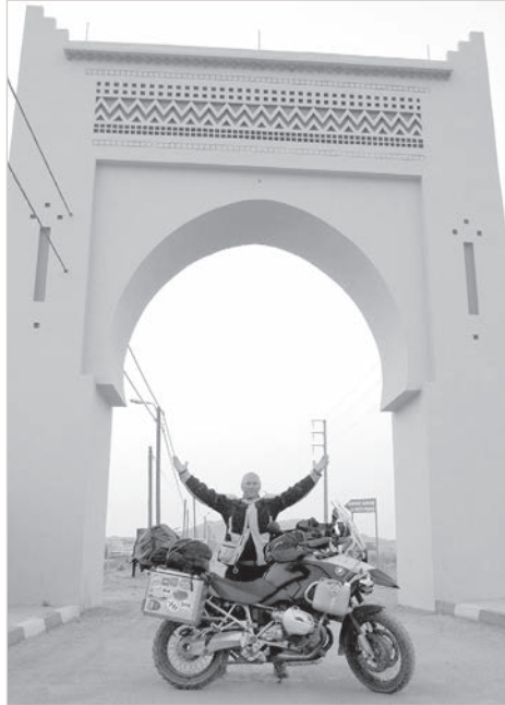
Ворота в Сахару.

На частый вопрос — как удается выходить на интересные темы? — обычно отшучиваюсь: с помощью мобильного. Вот и в этот раз позволил Сергей Шульга с интригующей новостью: