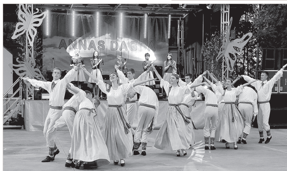
Народный танцевальный ансамбль «Дагда».