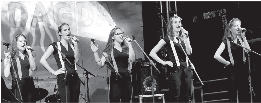
На сцене — эзерниекая «Гамма».