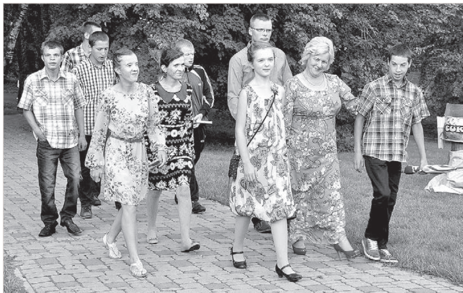
На праздник — всей семьей.