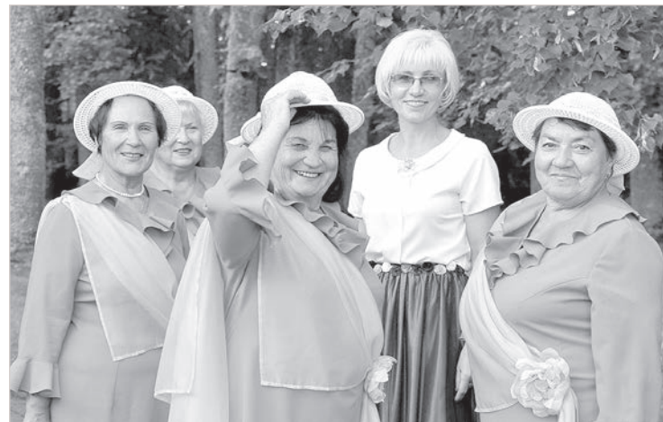
«Эзерини» после успешного выступления.