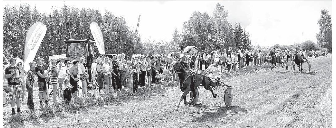
Один из десяти заездов.