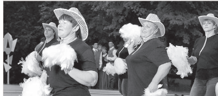
Асунский «Бальзам на душу».

тесно. Очень многие жители города и села прибыли на долгожданный праздник семьями. Кроме зрелищных удовольствий — широкое торгово-развлекательное предложение. И танцы до рассвета, музыканты группы «Что желаете» полностью оправдали название. А тучки, ходившие вокруг да около, почти не помешали всеобщему веселью. Несколько капель — не в счет. Среди многочисленных гостей встретил немало краславчан, довольных и счастливых. В культурном развитии у Дагды есть чему поучиться!