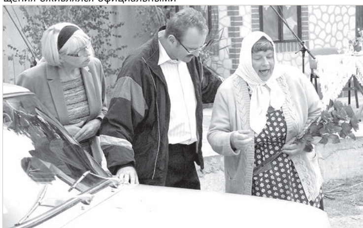
Сцена из спектакля.