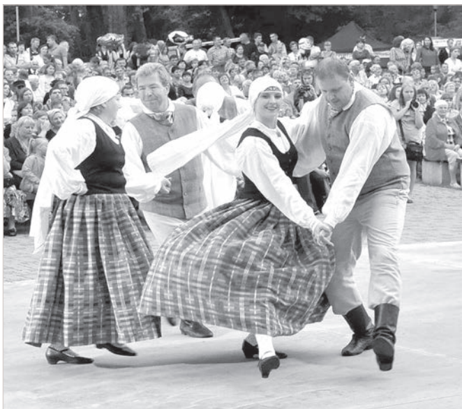
«Яутравиня», как всегда, в ударе.