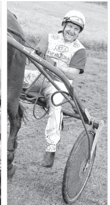
Литва — вне конкуренции!