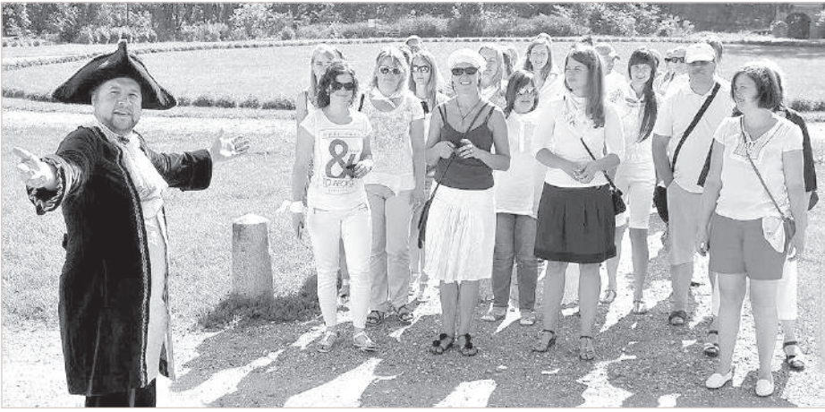
Граф Платер встречает гостей.