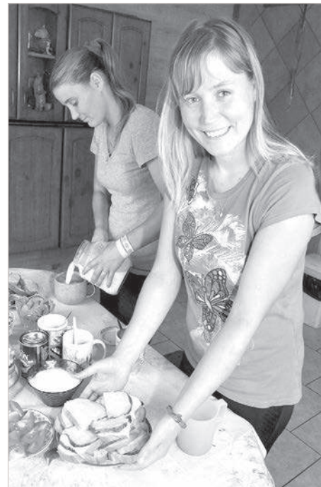
Добро пожаловать на деревенский ужин!