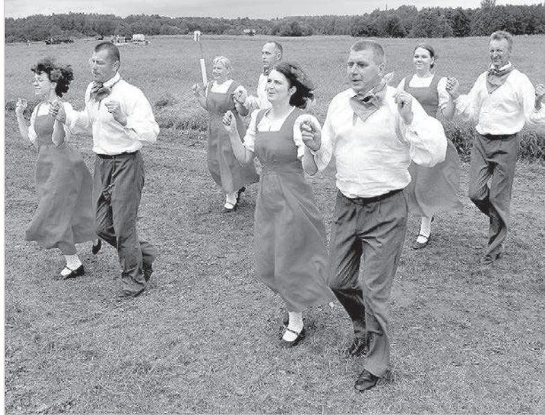
Субботнее начало — на беговой дорожке «Дагдское имение». Большой репортаж — в следующем номере.