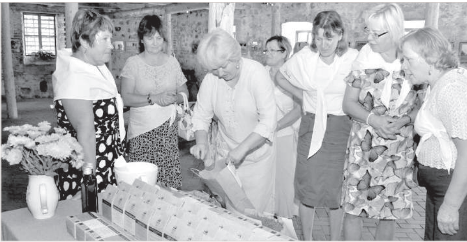
В царстве краславского чая.