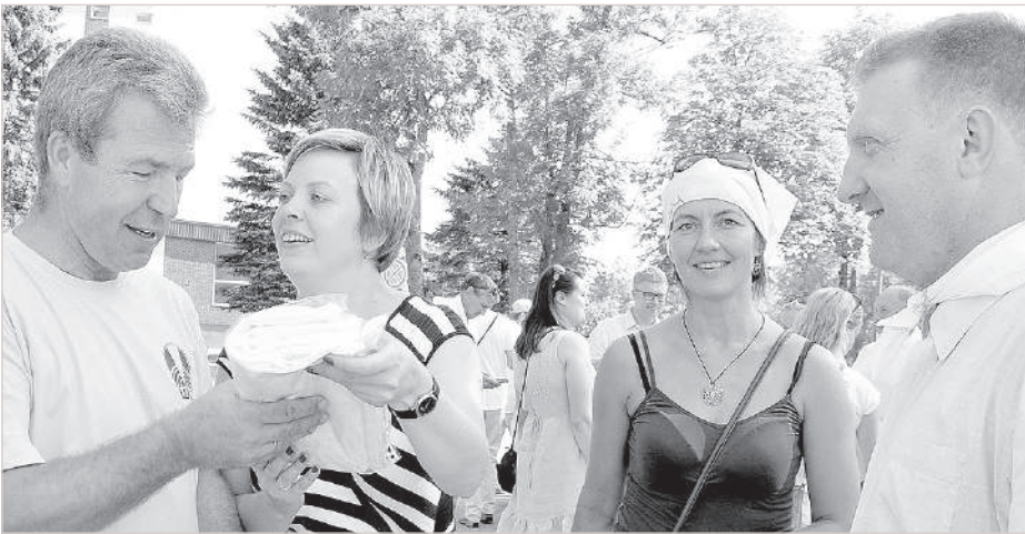
Обмен любезностями и сувенирами.