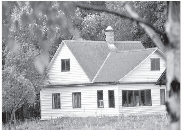
Обновленный соседний хутор.