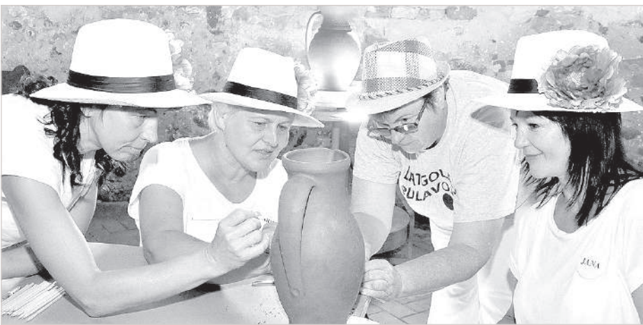
Тукумская роспись на латгальской керамике.

Латвийский центр сельскохозяйственных консультаций и образования ежегодно организует выезды в регионы — по обмену опытом. Так уж совпало, что двадцать пятая встреча состоялась в Краславе.