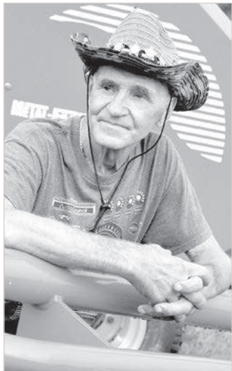
Глава семейства у новой техники.