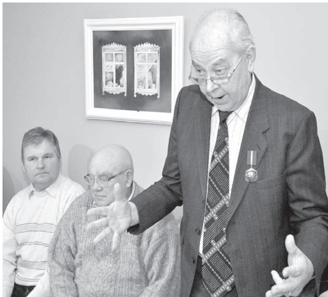
Рижские баррикады 1991-го года — это нравственный выбор каждого, экзамен на мужество и яркий пример единения людей доброй воли.

НА СНИМКАХ: эпизоды памятного мероприятия в Краславе.