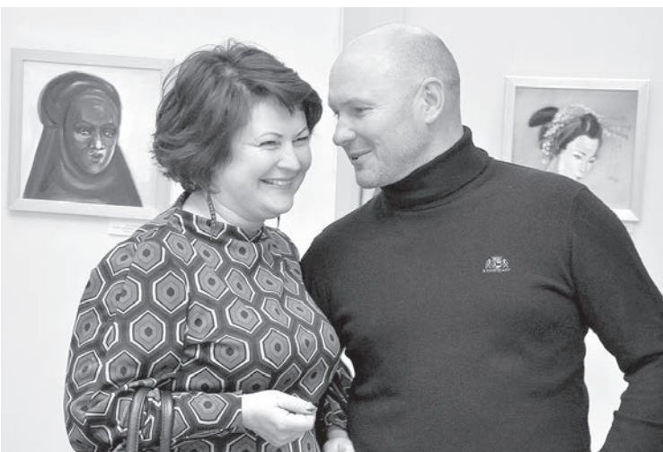
Вернисажи в Краславе — всегда дань уважения мастерам кисти и многочисленным поклонникам изобразительного искусства.

Kā putni aiziet dusēt Gar vakara debess maļu, Tā aiziet mūsu mīļie Uz kuso mūžības saļu.