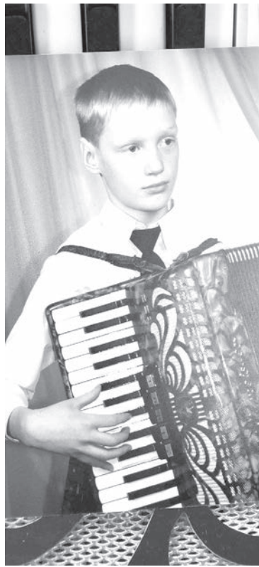
Начало музыкальной карьеры.