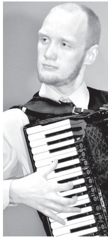
Ноктюрн — посвящение родной школе.