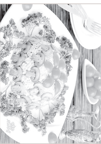
Рис с грибами и сыром Филадельфия Рис — 2 паке-тика, грибы — 500 г, лук — 1 шт., сыр Филадельфия — 250 г, сливочное масло — 30 г, соль — по вкусу, помидоры черри для украшения, петрушка

ное яйцо. Это очень хорошее сочетание для жареных баклажанов с грибами.