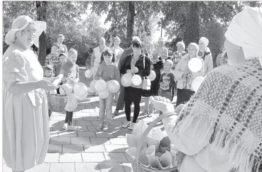
Викторина на улице.