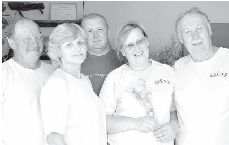
Самая сильная команда — Асуне!