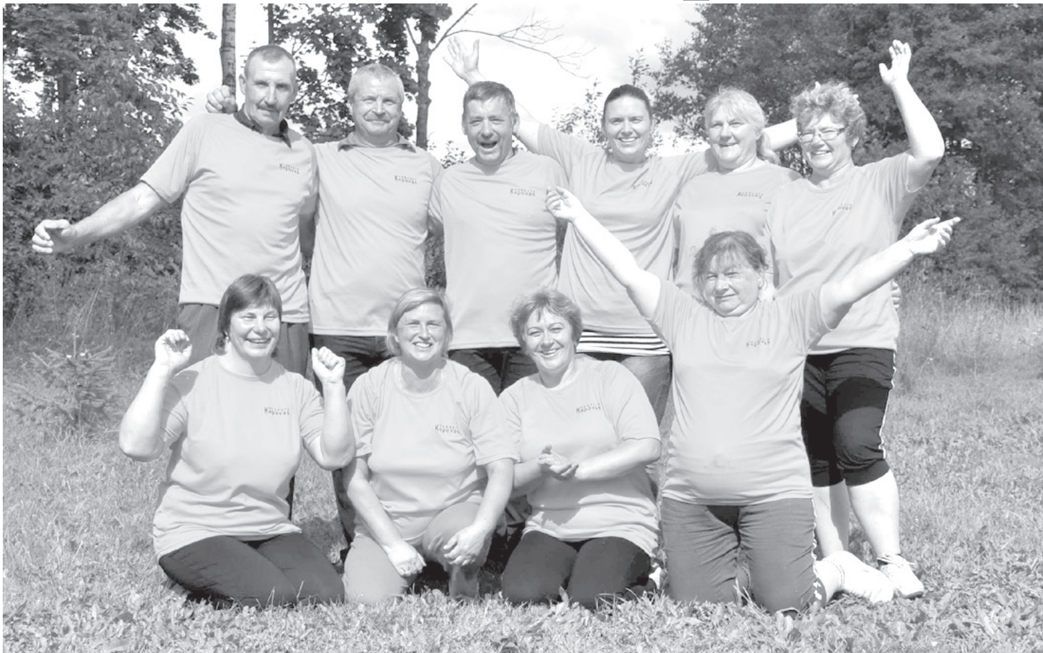
Организаторы необычного праздника — кеповская команда.

Живем трудно, однако, чтобы удержать оставшихся людей в Латгалии, очень важно следовать старинной поговорке «Делу — время, потехе — час».