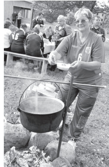
Подкрепляющая пауза и коллективная солянка.