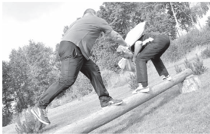
Мужской бой — на бревне.