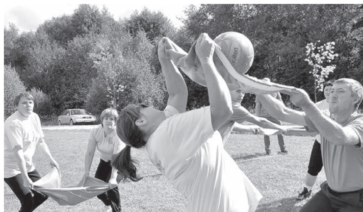
Волейбол с полотенцами — новинка сезона.