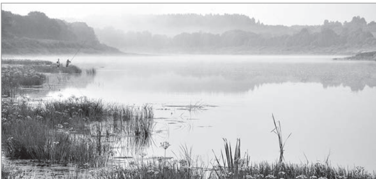
Латгальская романтика — полный восторг.