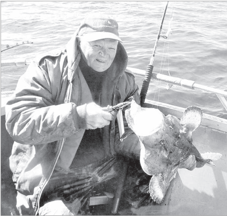
Вот такой морской черт.

Рыболовный сезон нынче — хуже не бывает. Хроническое похолодание первой половины лета вдруг обернулось нестерпимым августовским зноем — с плюсовыми рекордами в Латгалии. В обмелевшей до предела Даугаве вода прогревалась до 25 градусов, а это не только пассивность белой рыбы, но и богатство кормовой базы. Тот случай, когда при ловле в проводку и на фидер обильная прикормка эффекта не дает, а чаще отпугивает сытую рыбу. И если в конце июля можно