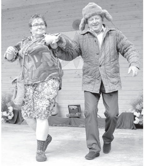
Лучшая пара из подтанцовки.

го праздника получили памятные призы — золотые скрипичные ключи, а звонкую эстафету приняли Робешниеки. Никто не спешил расставаться... Главный тост вечеринки — «Живи, деревенька моя!»