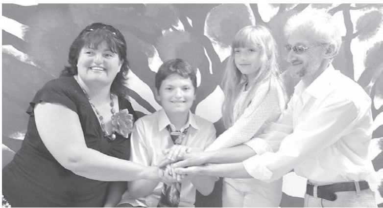
Музыкальная семья Суструпов.