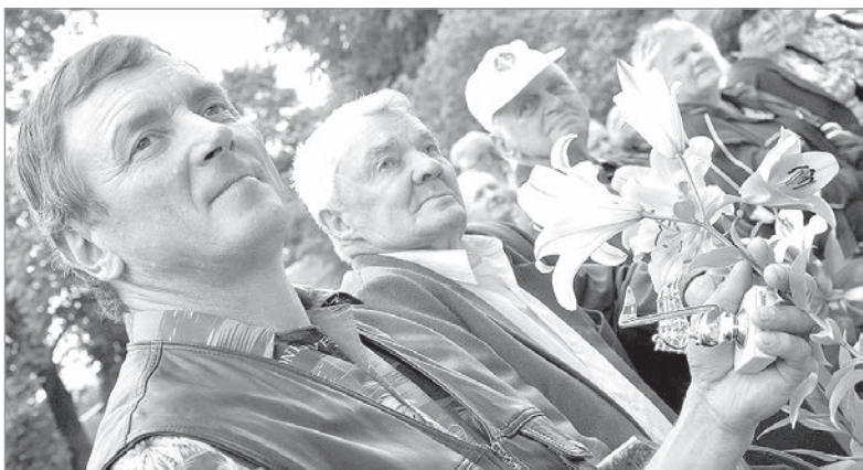
Музыканты — как на подбор.