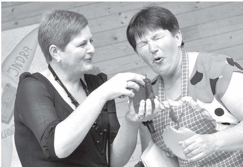
Дегустация индрского варенья после годовой выдержки.