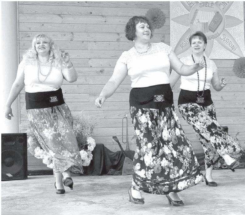
Зажигает ансамбль «Бальзам на душу».