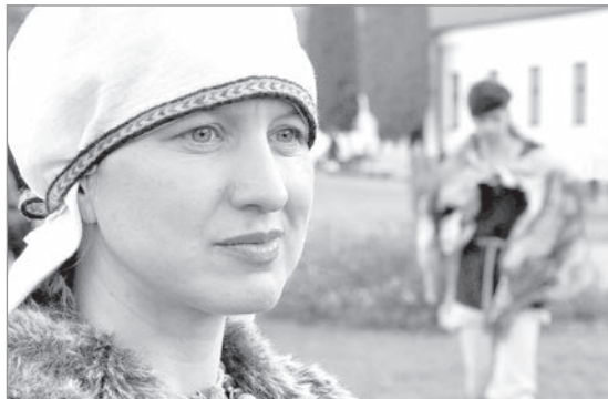
Люди, пони, кони...