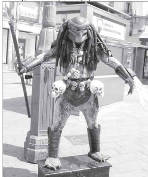
Живая скульптура развлекает туристов.

вручил улыбчивый портье. Сверился с планом центра города, стало понятно, что многие достопримечательности находятся достаточно близко, чтобы не использовать общественный транспорт (он дорогой в Мадриде). Поднимаясь по улице, на которой располагалась гостиница, я уже через 20 минут дошел до Королевской площади (Пласа Майор). Убедившись, что жизнь здесь и правда бурлит, задерживаться не стал и пошел дальше до самого сердца Мадрида, площади «Ворота солнца» (Пуэрта дель Соль). Толпа туристов, музыканты, акробаты, фокусники — здесь было все. Всем этим радостным «бурлением» полюбавался со стороны, первый день — разведка, отправился к отелю другим путем. Подороге заглянул в один из многочисленных тапас-баров, с разноцветным набором испанских закусок. На этом первый день и закончился... Нужно было хорошо выспаться, чтобы начать серьезное изучение города.