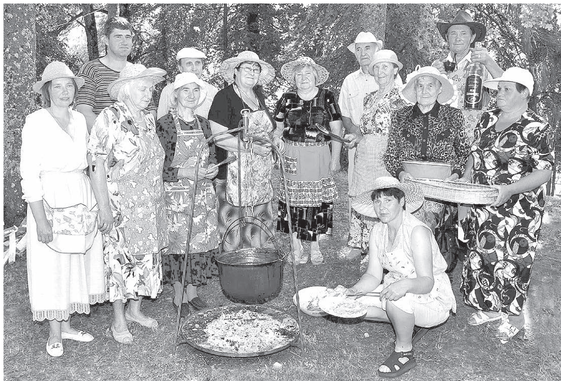
В следующем номере — большой репортаж о празднике варенья. И не только... НА СНИМКЕ: угощает улица Дарза.