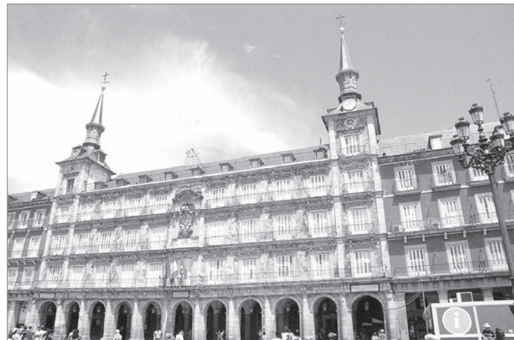
«Булочная» на Королевской площади.

Королевская площадь множество раз меняла название. Но мадридцы ее иначе как «королевской» никогда не называли. Лопе де Вега называл это место «пуп Испании». Квадратная площадь представляет собой дворцовый комплекс. Войти сюда можно через ворота, расположенные со всех сторон света. Во время праздников здесь проходят концерты. Именно здесь когда-то размещалась первая постоянная площадка