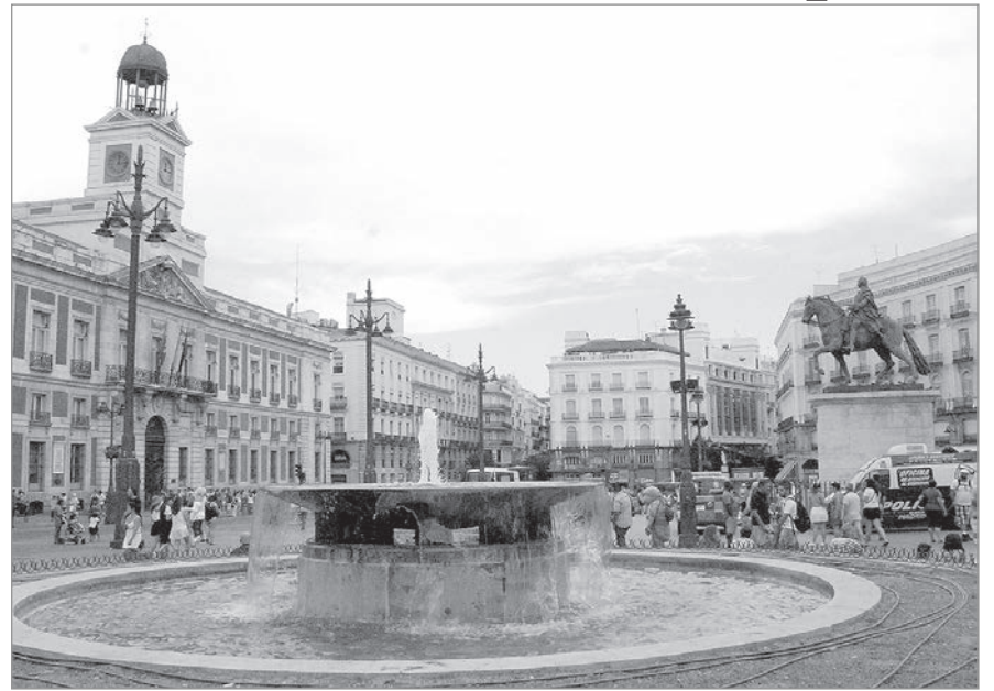
«Ворота солнца» — главная площадь Мадрида.

На площади активно торгуют афро-испанцы (вероятно, именно так нужно называть жителей Испании негроидной расы). Товары, которые они предлагают, бесхитростны, а цены весьма умеренны. Желающих приобрести сумочку от «настоящего» «Луи Виттона» или солнечные очки от «Гуччи» немного, а вот веера ярких расцветок по два евро за штуку расходятся очень хорошо. Торговля явно незаконная, но про-