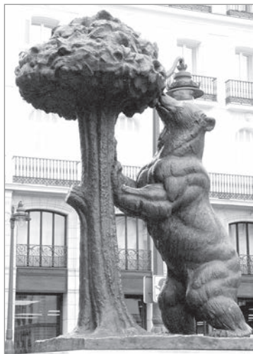
Главный символ Мадрида.

Четыре часа лета из Вильнюса — не слишком утомительно, даже если лететь компанией,