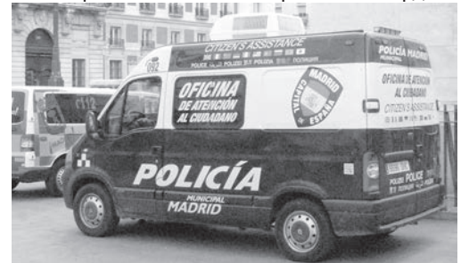
Полицейские-полиглоты на площади Пуэрта дель Соль.

га; фокусник-итальянец веселит публику мастерскими манипуляциями. В центре площади, у самого памятника, группа молодых людей с причудливыми прическами протестует. В чем суть протеста — непонятно, но юридически один из компаний поднимается и громко и сердито