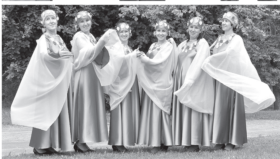
Яркие воспоминания о Дагдском фестивале белорусской культуры.