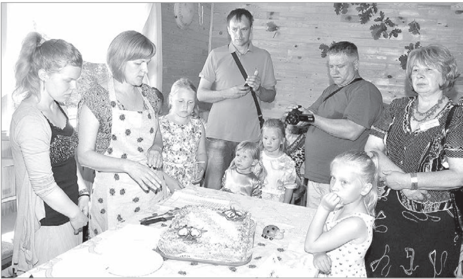
Конкурс «Сырно-хлебный праздничный соленый торт» состоялся в нашей стране впервые. Латгальский этап проходил в Аглоне.