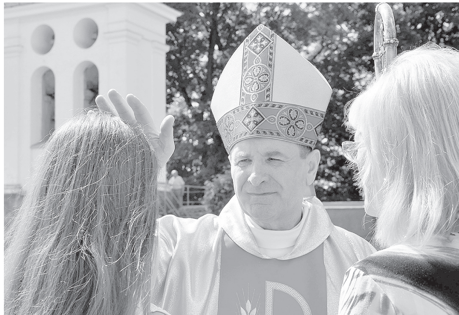
Статью читайте на 5-й стр.