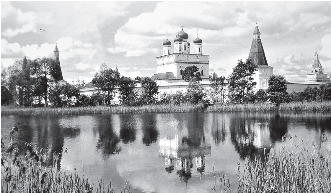
Панорама Успенского Иосифо-Волоцкого монастыря.