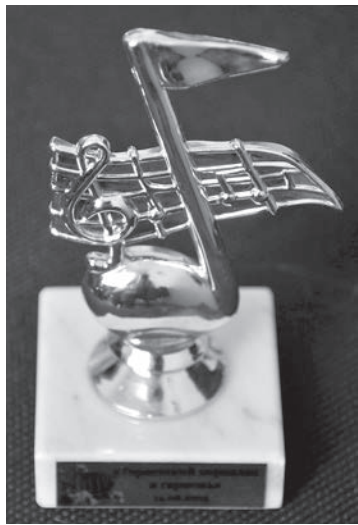
Памятный приз фестиваля «Теряевский перепляс и гармонь 2015».

В продолжение субботнего дня — светское представле-