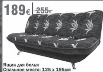
Ящик для белья Спальное место: 125 x 195см