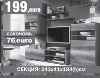
199, euro СЭКОНОМЬ 76, euro СЕКЦИЯ: 243x41x184(h)см