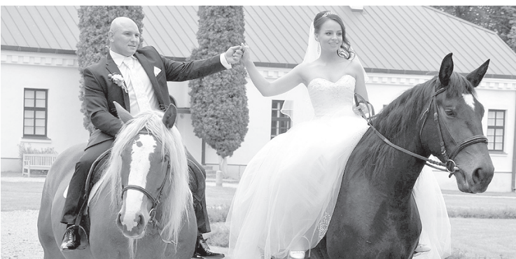
Когда лимузины не проходят...