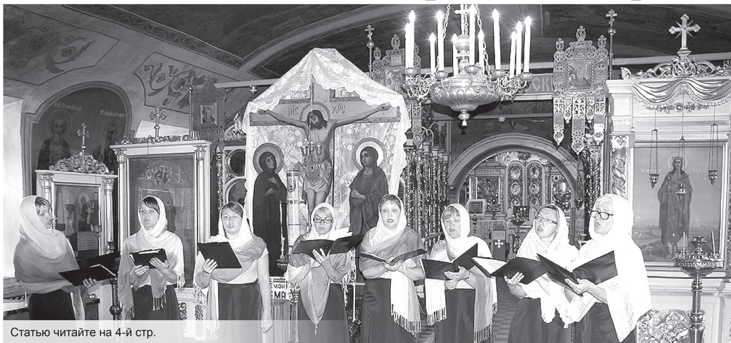
Статью читайте на 4-й стр.