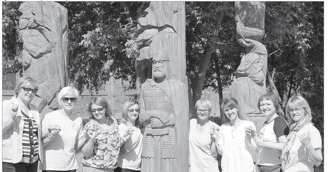
На древней земле Московии.

Три незабываемых дня... В творческом мире случайностей не бывает: ровно год назад я имел удовольствие рассказывать читателю о краславском дебюте в подмосковном фестивале «Теряевский перепляс и гармонь». Явный успех обернулся повторным приглашени-