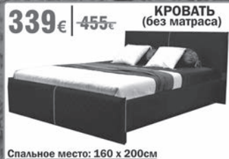
КРОВАТЬ (без матраса) Спальное место: 160 x 200см