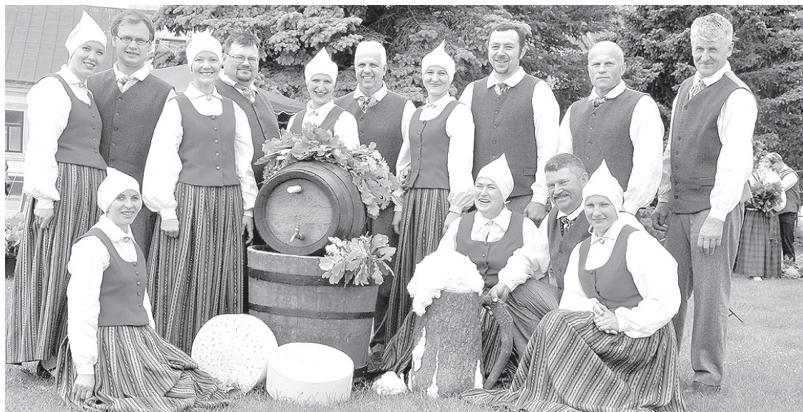
Краслава, лето, праздник...