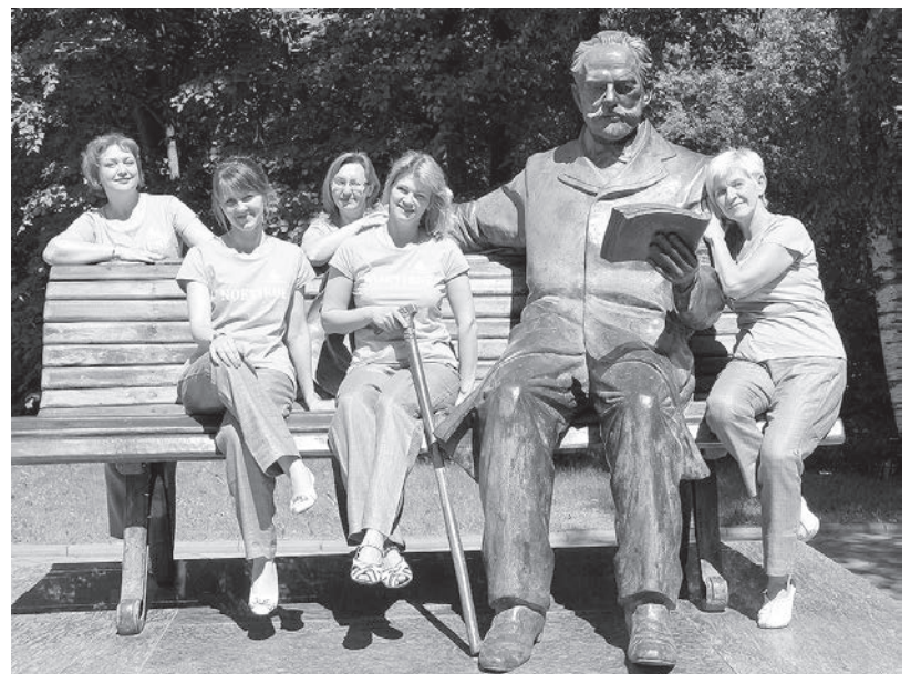
В музее Чайковского.