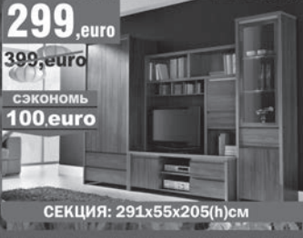
299, euro 399, euro СЭКОНОМЬ 100, euro СЕКЦИЯ: 291x55x205(h)см