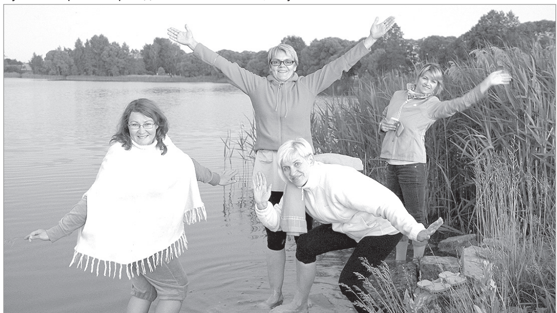
Открытие купального сезона.

В продолжение чудес второго дня — посещение в Волоколамске храма Покрова Пресвятой Богородицы. По преданию, бывший собор Успения Богородицы Варваринского монастыря основан в XII веке Андреем Боголюбским. Дошедший до нас