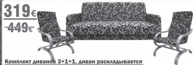
Комплект диванов 3+1+1, диван раскладывается