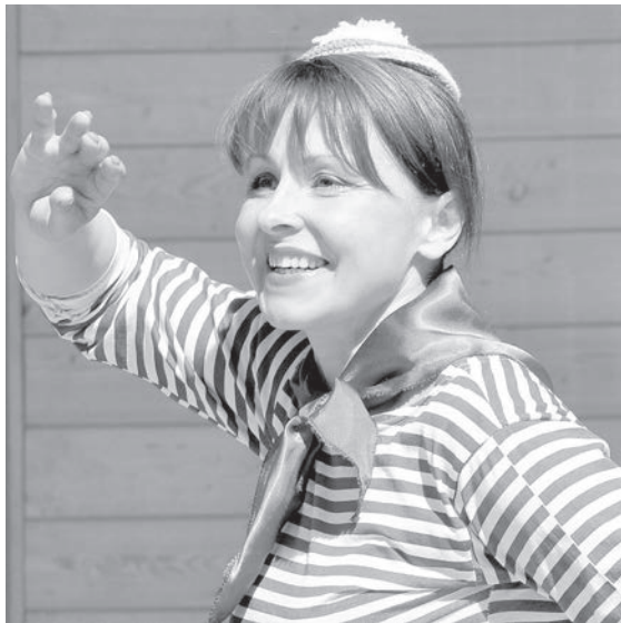
В следующем номере — большой репортаж из Асуне.