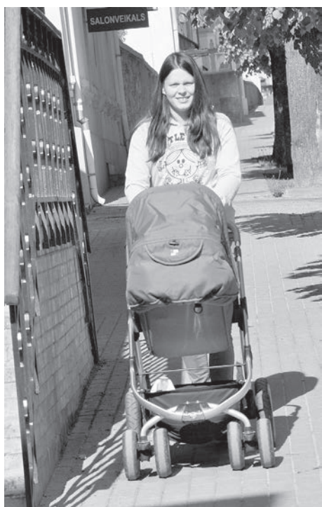
Два сюжета на тему демографии.