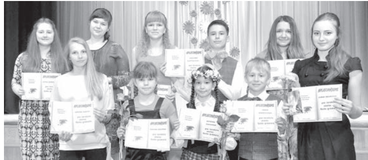
Их имена в школьной Книге почета.