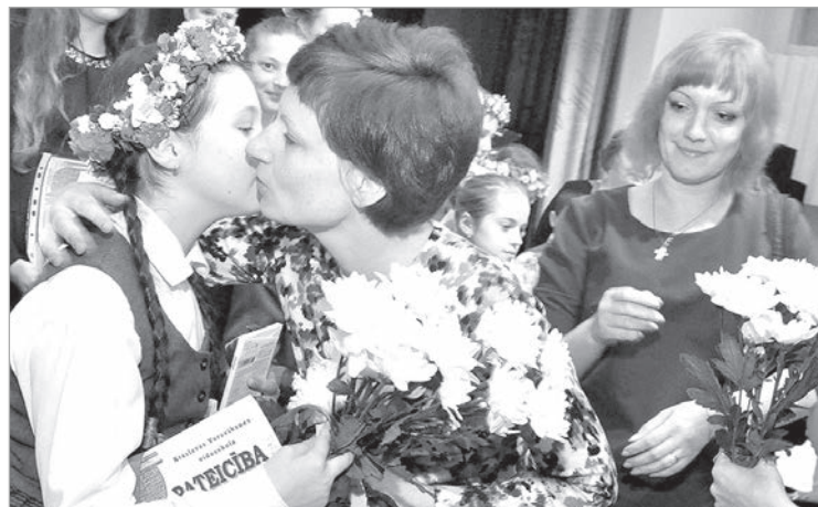
Один из множества поздравительных моментов.