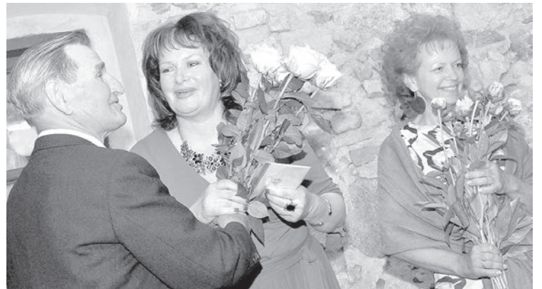
С близкими друзьями.