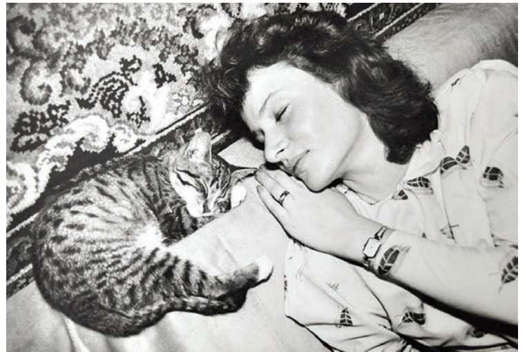
Постановочный газетный снимок «Тихий час» — в первый краславский год.