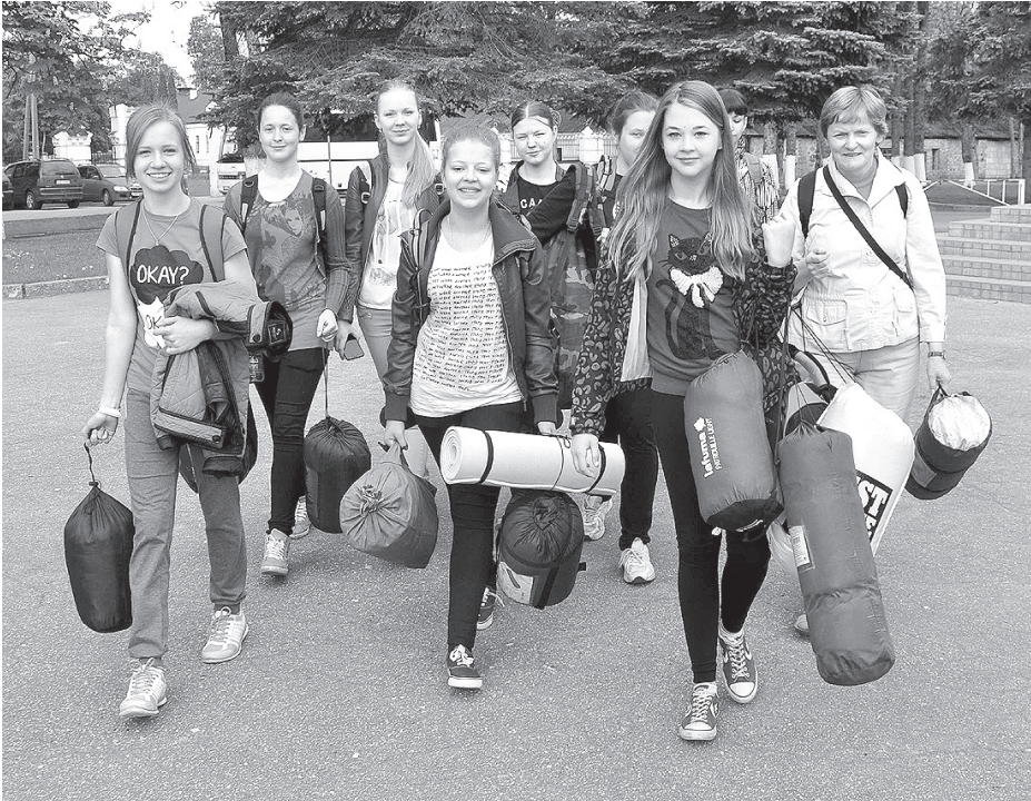
В долгожданный поход.