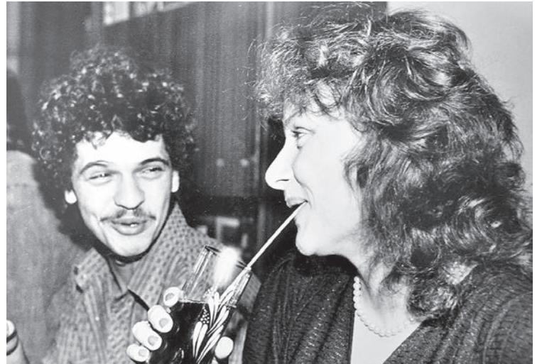
Встреча гостей из Румынии — четверть века назад.