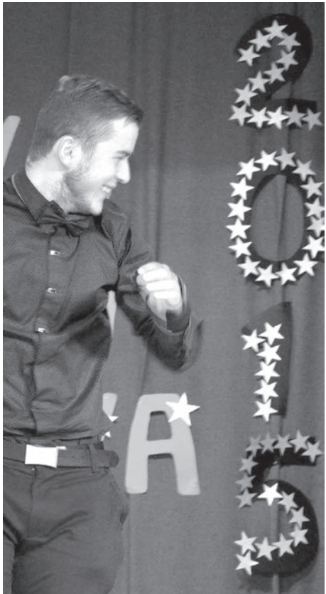
Янис Цауня — обладатель приза «NBA сэгба».