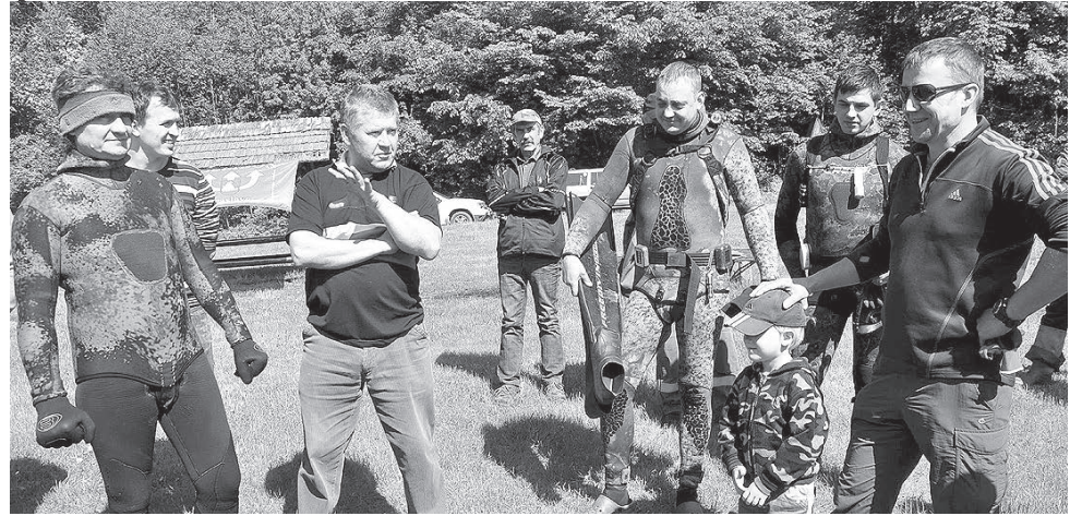
Второй субботник на озере Зирга: постановка задачи.