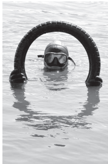
Со дна озерного.