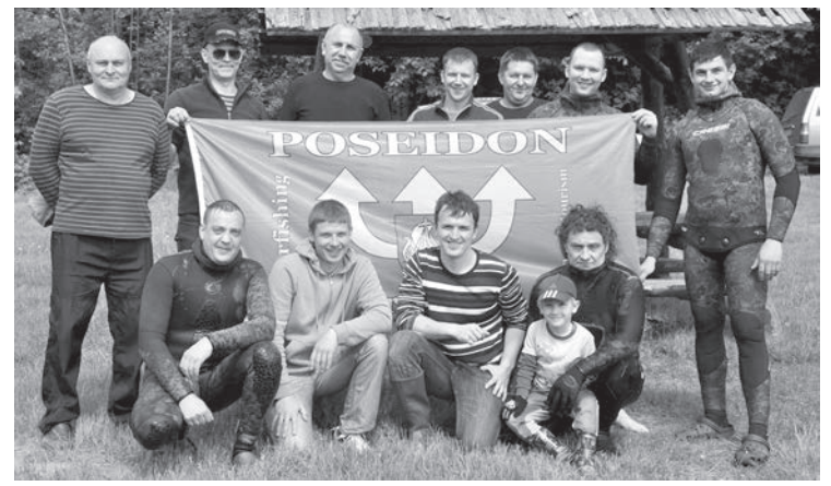
Снимок на память.