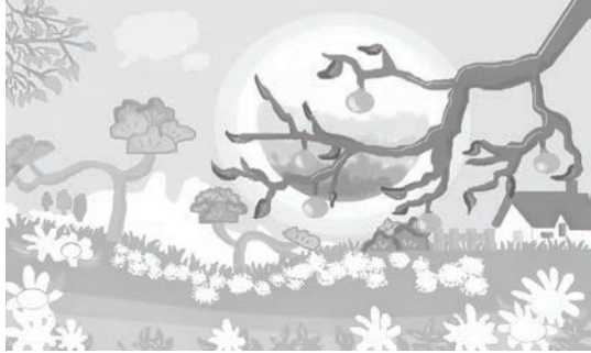
1-4-е классы (всего 16 работ):

В конкурсе «Мое любимое время года» участвовало семь школ: Аулейская основная (1 работа), Индрская средняя (12 работ), Калниешская основная (3 работы), «Варавиксне» (12 работ), Робезниекская основная (2 работы), Саулескалнская начальная (2 работы)