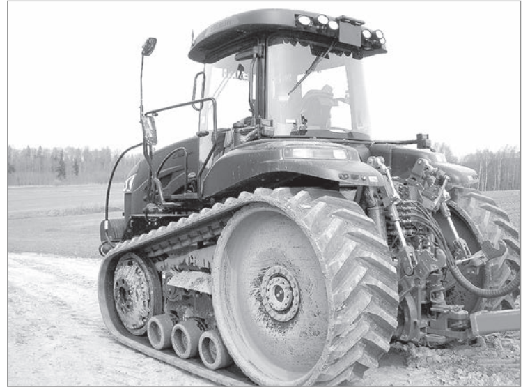
Американский гусеничник «Challenger».