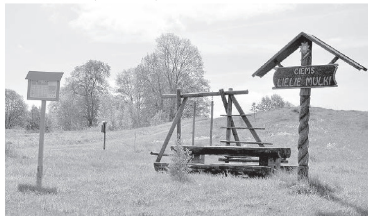
Уголок отдыха для туристов, оборудованный владельцами усадьбы «Цирули».