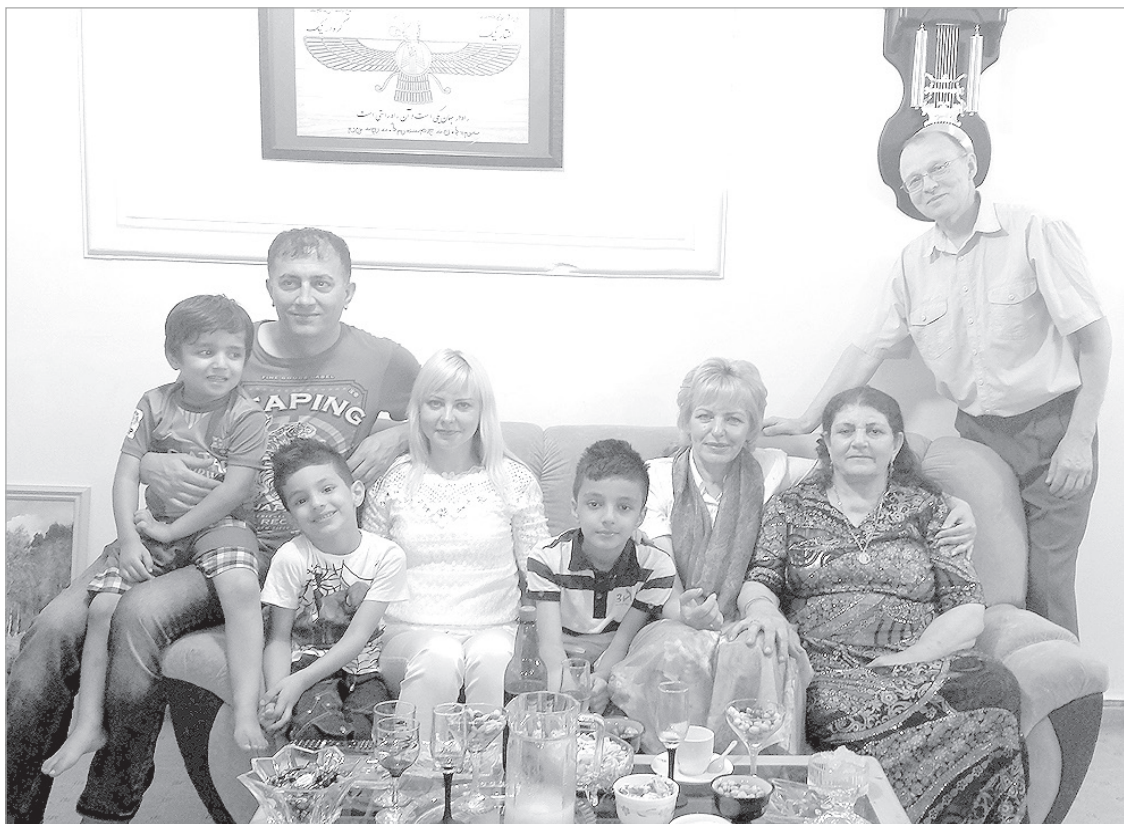
Фото на память — с иранскими родственниками.