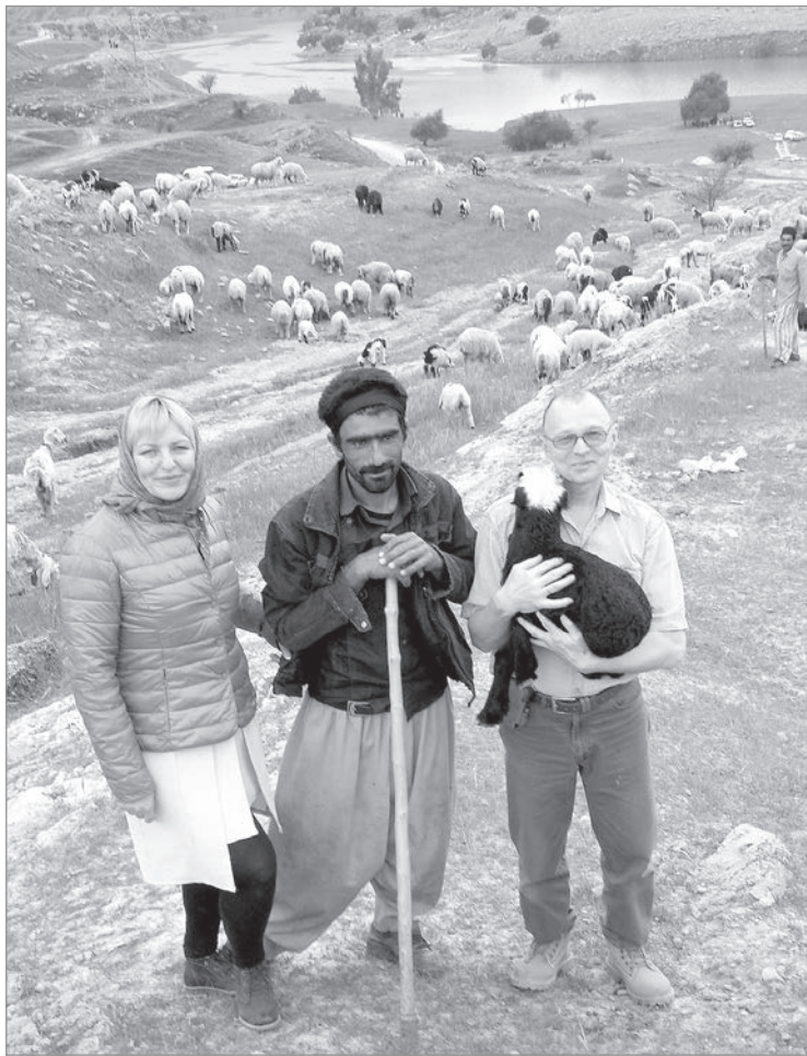
Встреча в горах.