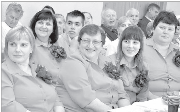
Андзели: неподдельная радость.