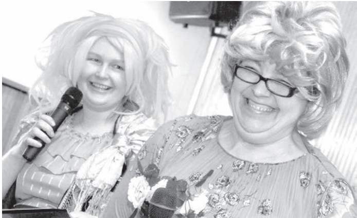
Неунывающие Нутелла и Зепка.