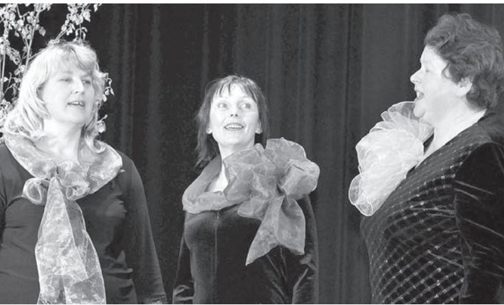
Маленькая часть большого аглонского песенного представления.

Если от гостей нет отбоя — это самое красноречивое подтверждение популярности праздника, ставшего не только традицией, но и ярким событием в культурной жизни Латгалии.