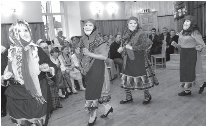
Вот такие Бурановские бабушки!