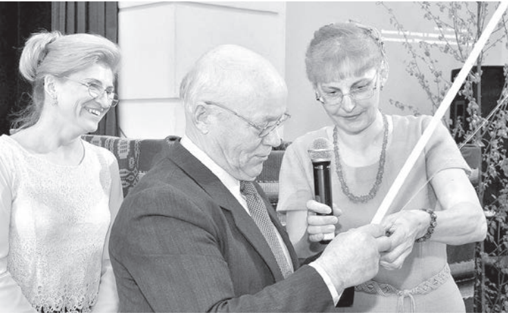
Жеребьевка в форме рыбалки.