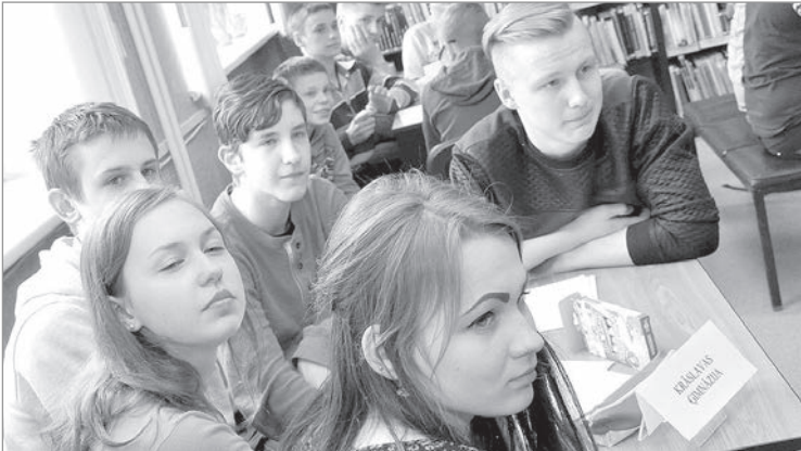
Гимназисты в раздумье.