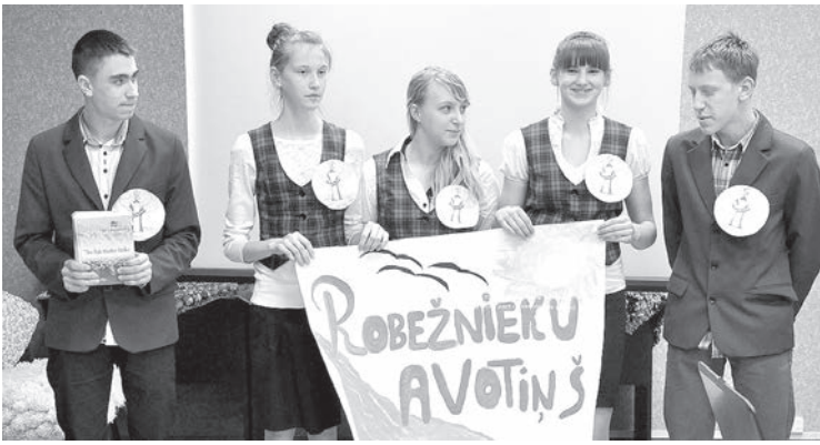
Фрагмент презентации команд.