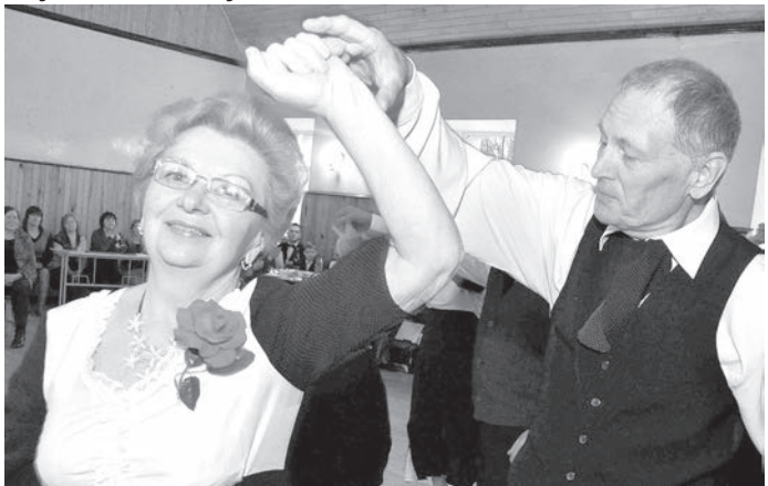
Индра продолжает удивлять и радовать.