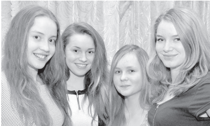
Школьный квартет — украшение бала.