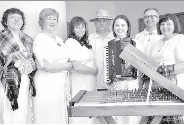
Всегда в настроении «Sovvalņiki».