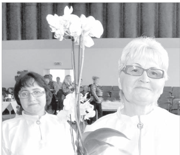
Шкяунский весенний привет.