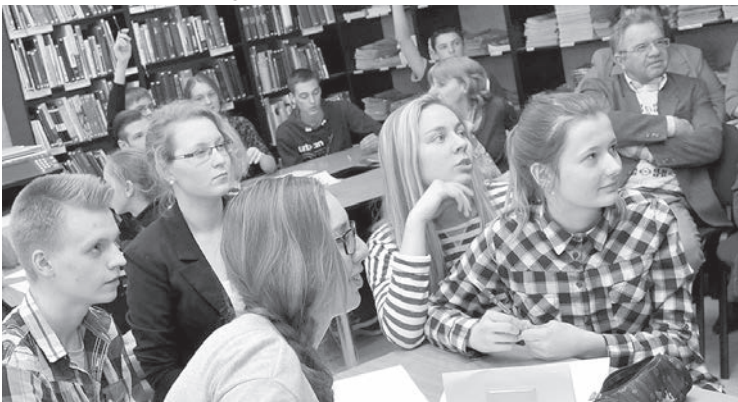
Пятерка из Краславской основной школы.