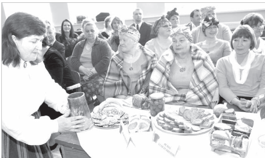
Маконькалские фольклористы — обладатели приза зрительских симпатий.