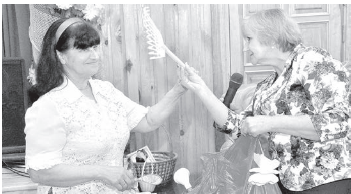
Аулея — Извалте: актуальный подарок для наведения весенней чистоты.