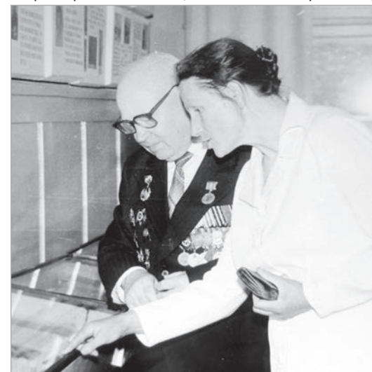
С ветераном ВОВ.

Эзерниекскую школу Манефа давно не посещала. Сама утверждает, что не хочет быть в тягость людям, а своими силами не может туда попасть. Но она следит за школьной жизнью, в том числе и через газету