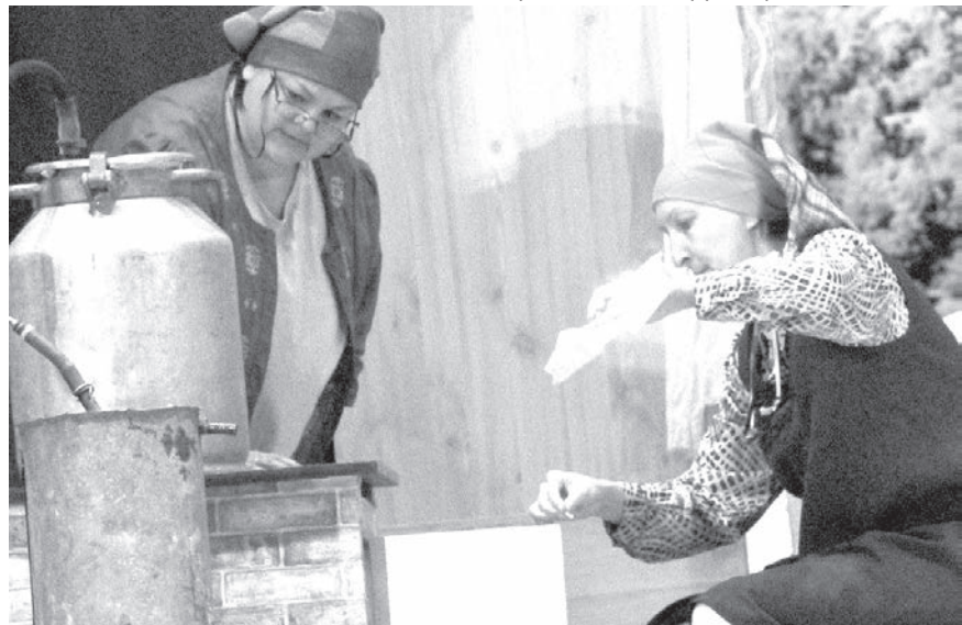
« Sievas mātes bizness ».