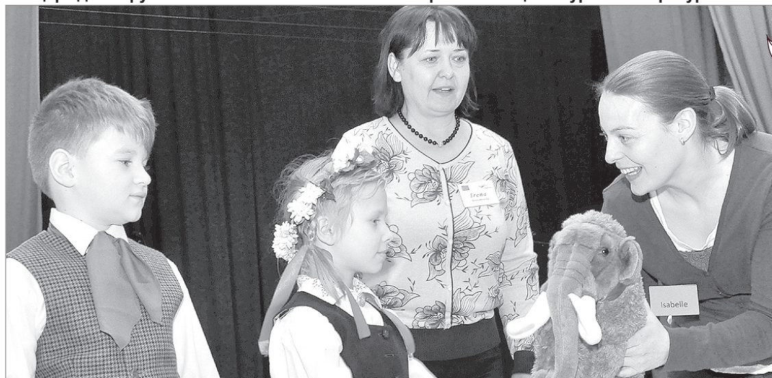
Сувенир из Германии.

О международной встрече педагогов в школе «Варавиксне» — в следующем номере газеты.