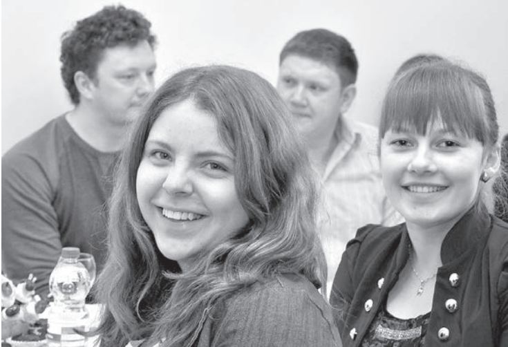
И молодежь в восторге.