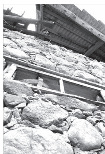
Ответ записал Юрис РОГА.

ти средства, чтобы просто снести здания, у него тоже нет возможности. Доходы от туризма в последние годы были небольшими, поэтому свободных средств, чтобы привести здания в порядок, нет. Это не так просто — необходима грузовая техника, другой автотранспорт. Выделить ему от волости одного безработного? Такими силами там ничего не сделаешь. Но я однозначно могу утверждать, что со стороны хозяина есть понимание того, что здания портят среду и ситуацию необходимо менять. Тем не менее, какое-то время кардинальных изменений там не будет. Хочу подчеркнуть еще раз: в волости существуют позитивные тенденции, и нынче продолжим начатое, поставив акцент на волостном центре».