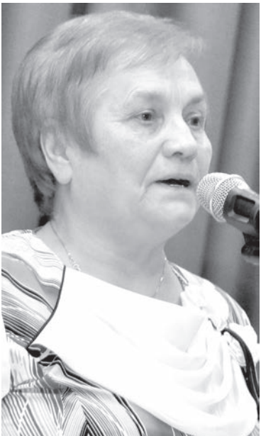
Поэтесса Зоя Ионина.