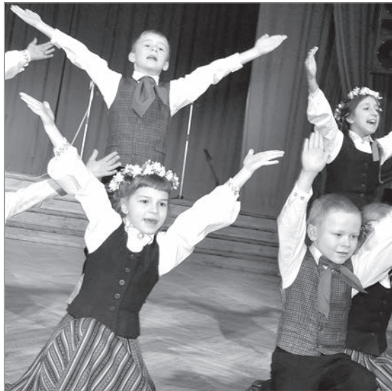
Концерт для зарубежных гостей.