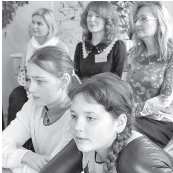
Во время посещения урока литературы.