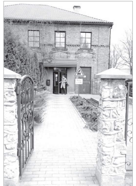
ТИЦ и ЗАГС теперь в одном здании.