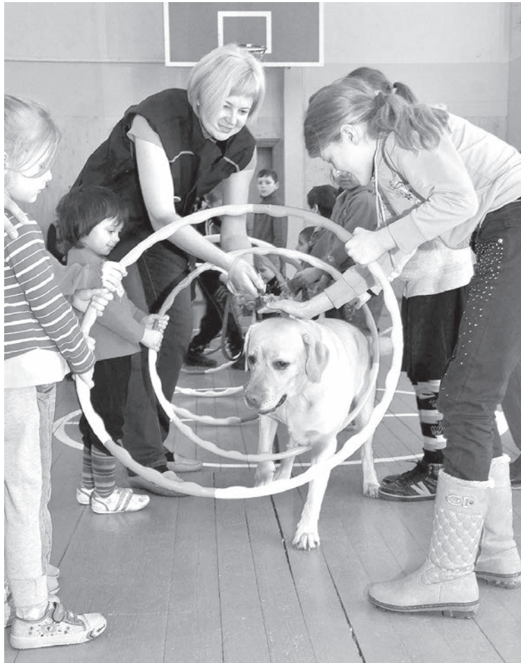
В следующем номере газеты — рассказ о канистерапии, методе лечения и реабилитации с использованием специально обученных собак.

Соревнования Краславского края по подледной рыбной ловле состоятся 7 марта. Регистрация — 7.30-8.00 у Комбульской волостной управы. Начало соревнований — в 9.00 на озере Дридзис. Информация: www.kraslava.lv Тел. для справок 29435179