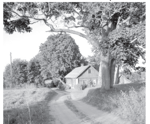
На окраине Удрии (Сергей Кудрявцев).