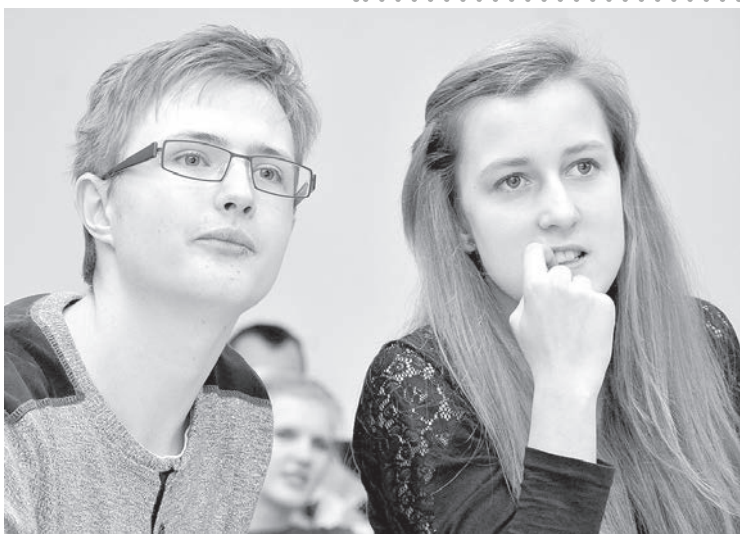
В следующем номере — репортаж с необычного конкурса в гимназии.

Международное агентство «Gestalt Communications», базирующееся в Нидерландах, предложило нашей стране заменить павильон на выставке «World Expo 2015» парком, который символизировал бы Латвию как страну, богатую лесами, пишет «Diena». Расходы на обустройство парка составили бы 1,08 млн. евро вместо 3 миллионов на строительство павильона.