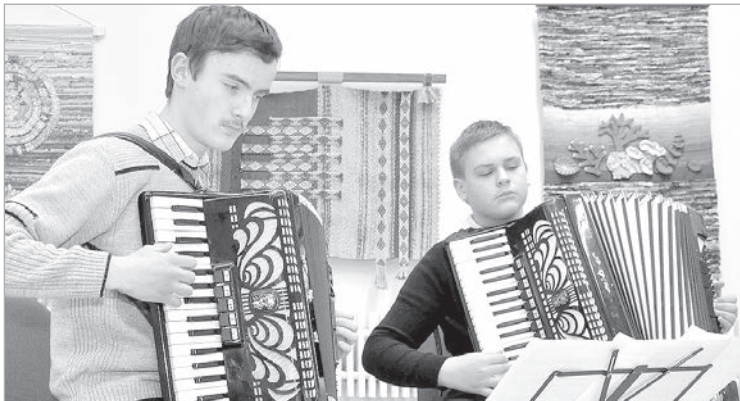
В ритмах созвучия.