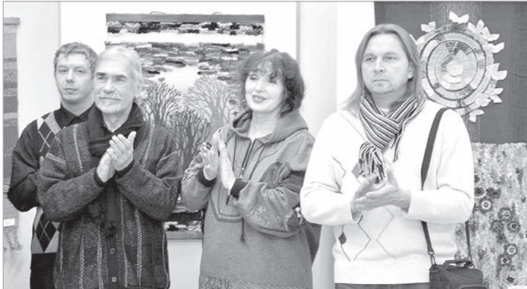
Штатные посетители выставок.