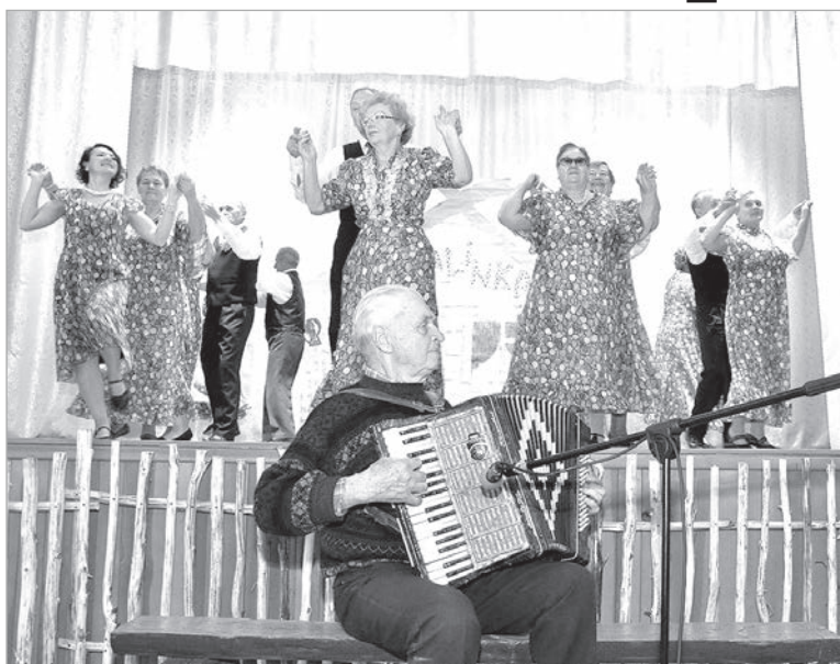
И в Индре, и в Эзерниеках любят песню и танец.