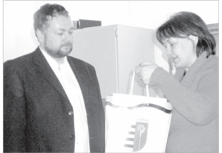
Подарки из Краславы администрации региона Коуволла.

Субботним утром мы отправились в Художественный и ремесленный центр «Тайдеруукки». В бывших цехах и производственных помещениях сейчас расположились мастерские ремесленников, студии художников и маленькие магазинчики, в которых можно приобрести как необычные сувени-