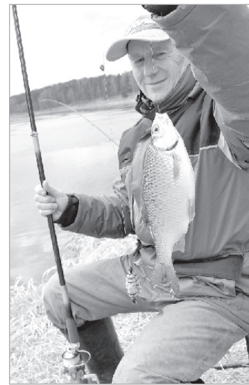
Первая речная плотва.

гих видов рыбы ничто не помешает. Разве вы не замечаете, что продолжает резко падать продуктивность естественных водоемов Латгалии, а более чем скромные рыбохозяйственные