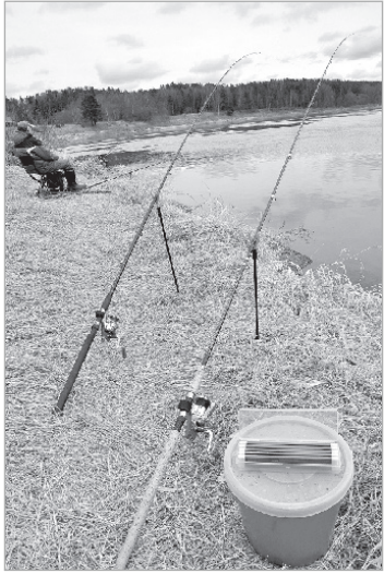
Берег рыбацкой радости.

Рыбалка, прежде всего – мечтание в тишине. Созерцание воды отвлекает от всех дум на земле. Вот почему мы с таким нетерпением рвемся на берега, а весенний сезон нын-