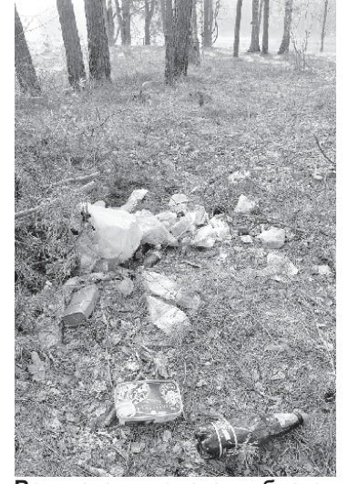
Вот такая людская «благодарность».