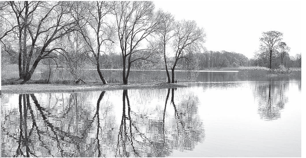
Dagdas ezera krāšņums.

vārdiem vietējos meistarus, pats nemaz nešaubījos – būs interesanta reportāža! Ezera flotiles ierašanās – neizmirstams skats!