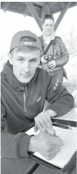
Prestīžo balvu kandidātu atgriešanās.

cējis kopš tiem laikiem, "zilās āres" kļuvušas nabadzīgas, bet zivju resursu atjaunošanas piemēru Latgales ezeros pagaidām nav pārāk daudz... Ņemt no dabas ir vieglāk nekā dot.