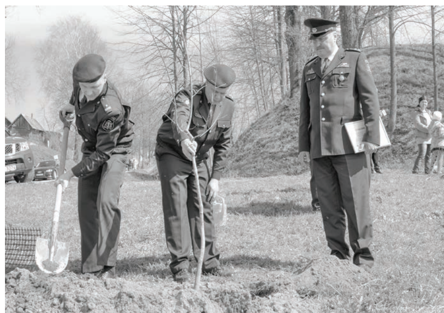
Plašāku pasākuma atspoguļojumu lasiet nākamajā numurā.