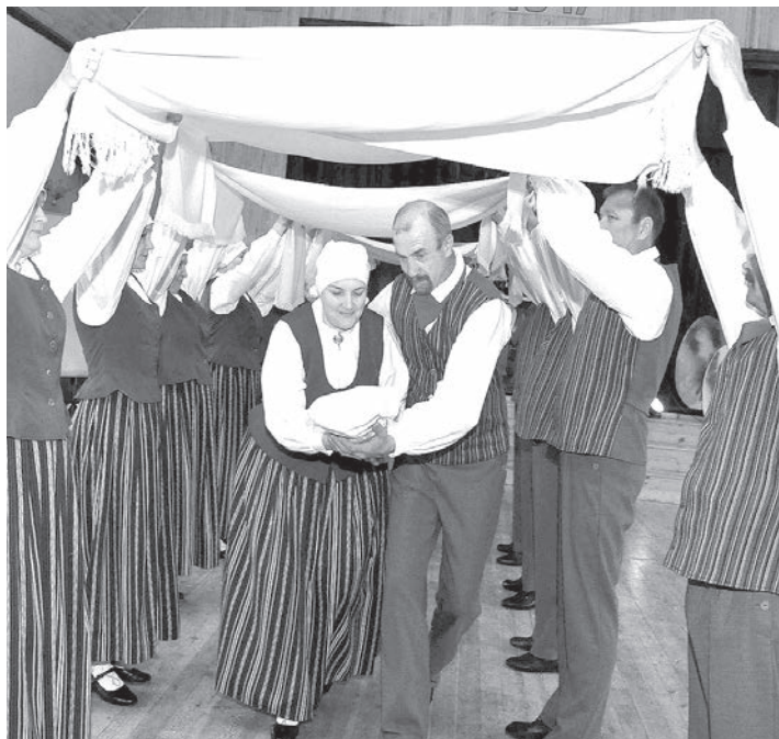
Bet Izvaltā izskanējis Jura dienas pasākums. Svētku programmu atklāja deju kolektīva "Šaltupe" uzstāšanās.