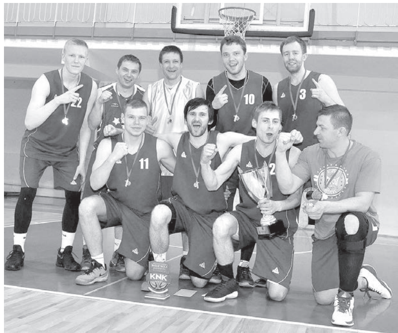
Krāslavā aizvadītas tradicionālās kausa izcīņas spēles basketbolā vīriešiem. Uzvarētāji - studentu komanda!