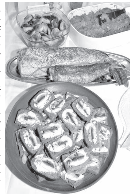
Zivju ēdieni jebkurai gaumei.

sipoliem un burkāniem. Otrs variants – šo pašu masu salikt čuguna traukā un sautēt uz uguns, bet vislabāk krievu krāsnī divas stundas. Šīs delikateses izgata-