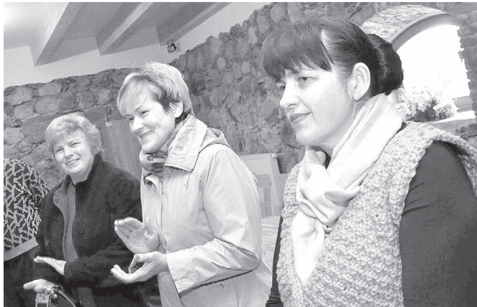
Ezera asariši no karstas kūpinātavas.