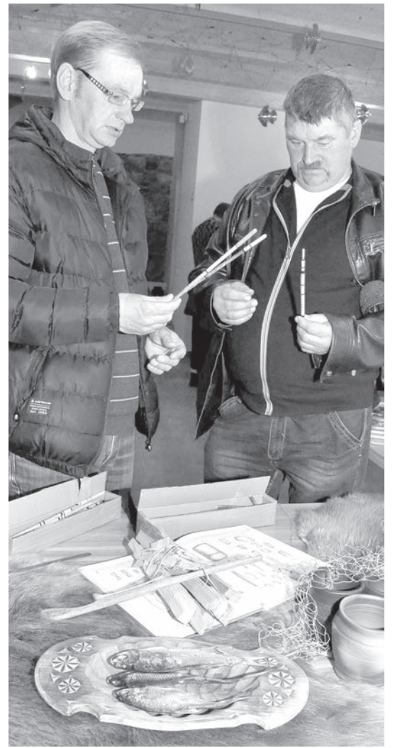
Divi Jāņi – Kupra un Maļķevičs.

vošanai der raudas un viķes. Ja gribēsiet izmantot lielākas zivis, tad vislabāk izņemt mugurkaulu – tā iesaka pieredzējusi kulināre.