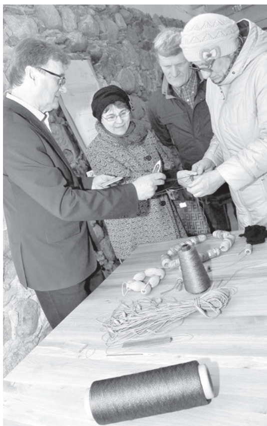
Tīklu aušanas darbnīca pēc vecvētu metodes.