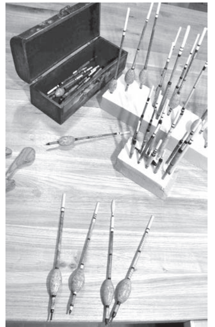
Unikālie pludiņi no ezeru niedrēm.