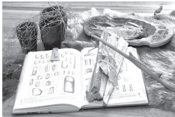
Klusā daba atbilstoši tēmai.

Ideāli der salaka (kazrags), kura arī mīt mūsu ūdenstilpnēs. Izlīrīt, nogriezt galvas, apcept miltos. Visu salikt stikla burkā un uzliet mērci no apceptiem