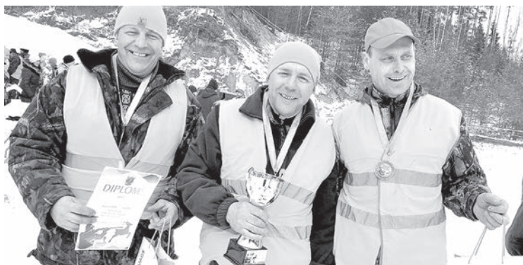
Mednieku sporta spēļu Konstantinovā atskaņas