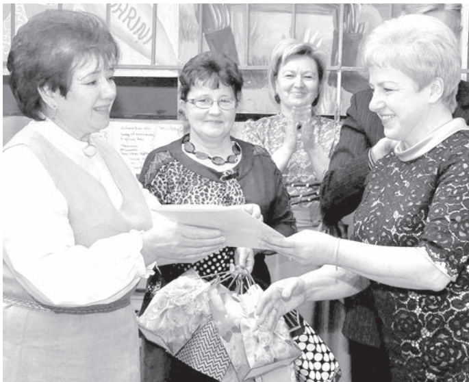
Apsveikums ansambļa vadītājai.