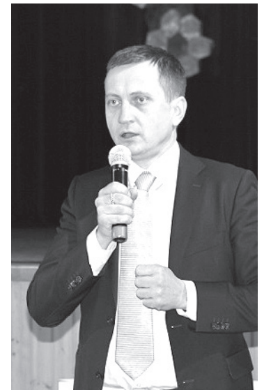
Informāciju sagatavoja: Guna Malinovska, Dagdas novada pašvaldības Sabiedrisko attiecību un komunikāciju nodaļas vadītāja

Otro Starptautisko Latgales reģiona biškopju konferenci organizēja Dagdas novada pašvaldība sadarbībā ar Latvijas Biškopju biedrību un SIA "Latvijas Lauku konsultāciju un izglītības centrs".