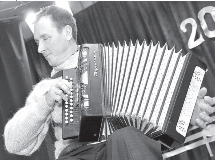
Kāda gan ballīte bez ermoņikām?!