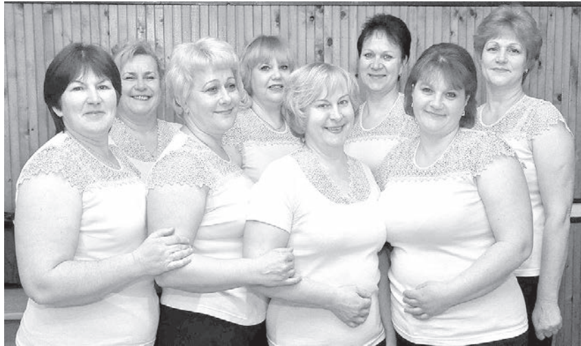
Asūnes "Balzams dvēselei".