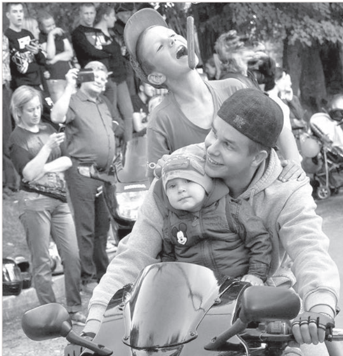
Nākamajā numurā - starptautiskais festivāls "Latgales vainags" Indrā un Grāveru pagasta svētki.