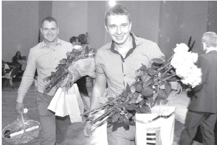
Patīkams apbalvojumu birums