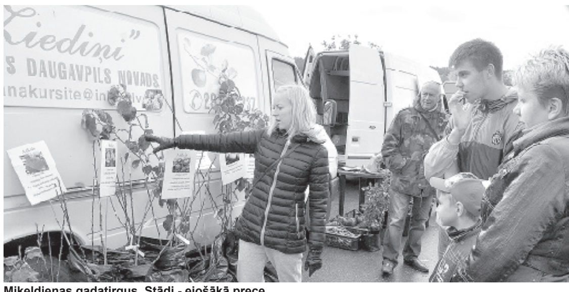
Miķeļdienas gadatirgus. Stādi - ejošā prece