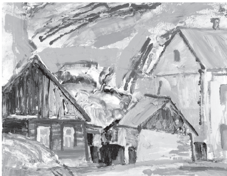
Jaunas gleznas - mākslinieku dāvana pilsētai