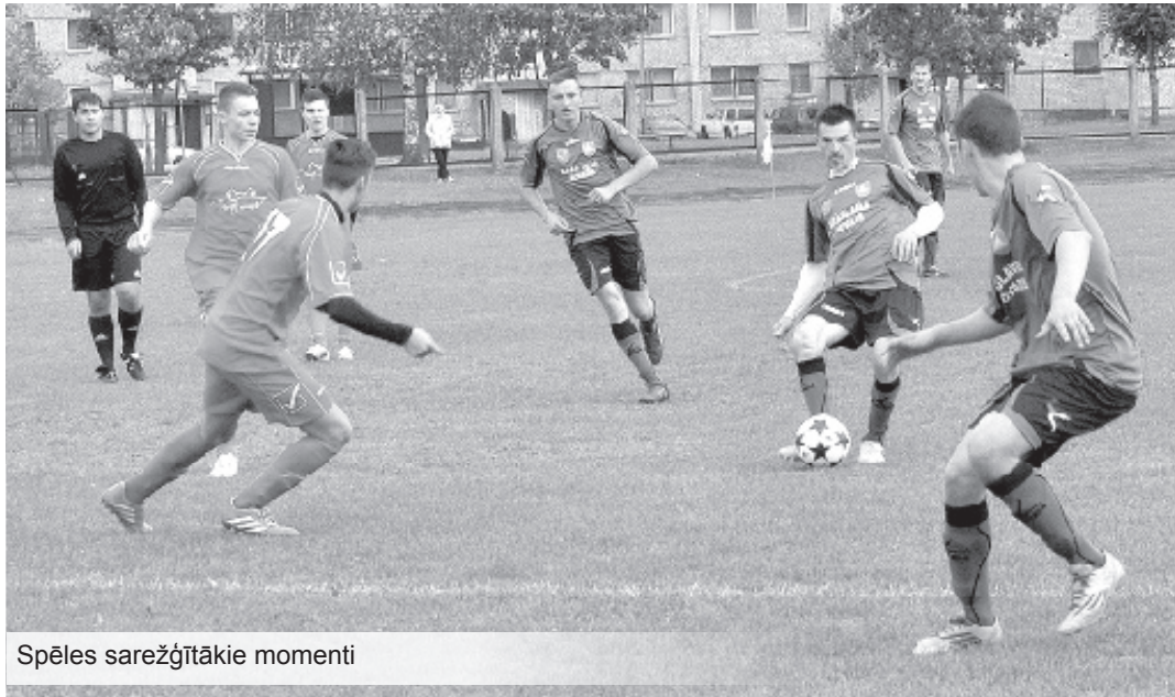
Spēles sarežģītākie momenti