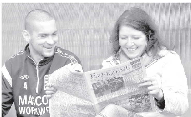
„Ezerzemes” numurā - reportāža par futbolu