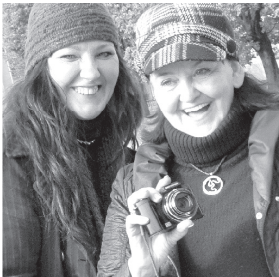
Starptautiskā plenēra „Krāslavas paleta 2014” noslēguma pasākuma dalībnieki