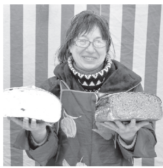
Lietuviešu maize no Kauņas