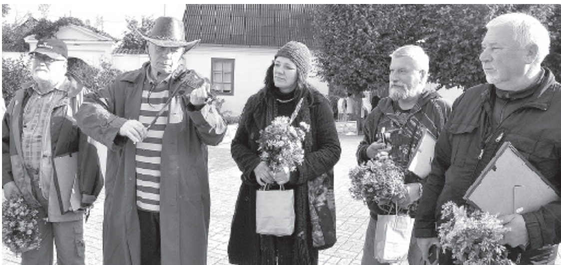
Noslēguma akords – mākslas joma