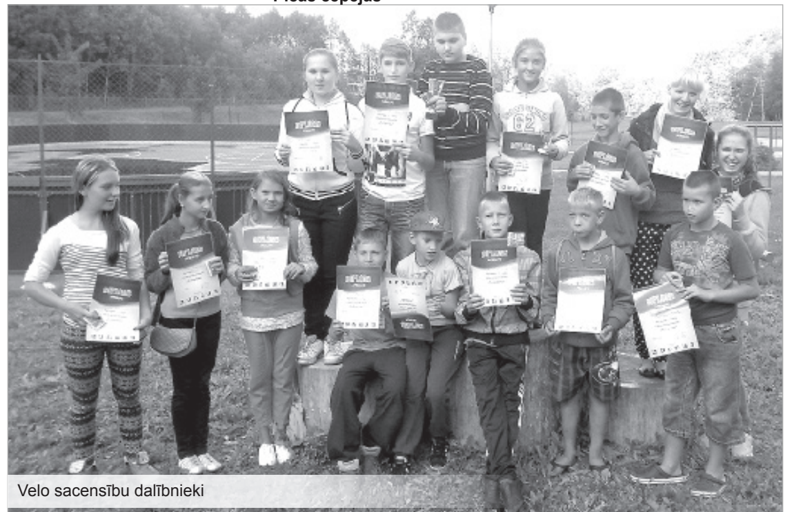
Velo sacensību dalībnieki