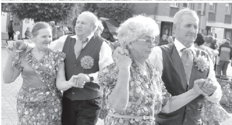
Daži fragmenti no svētku kultūras programmas.